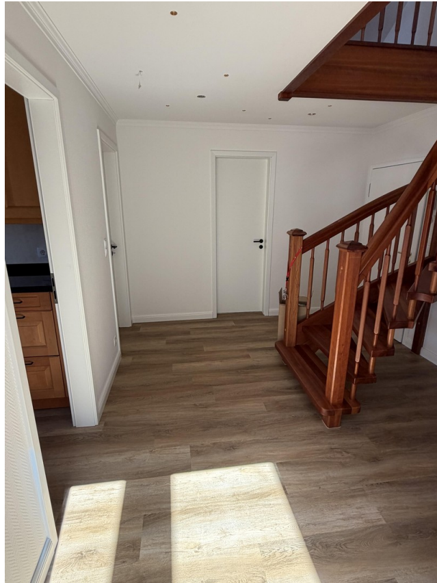
Eingang & Treppe