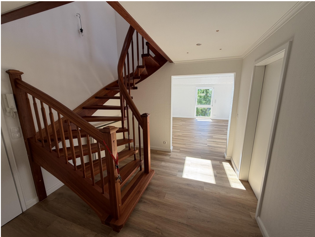
Eingang Flur & Treppe