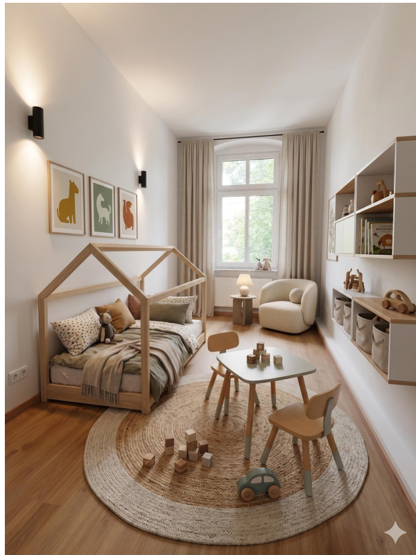
Kinderzimmer 2 muster