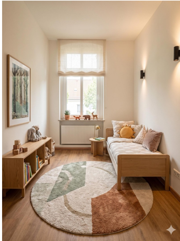
Kinderzimmer 1 muster