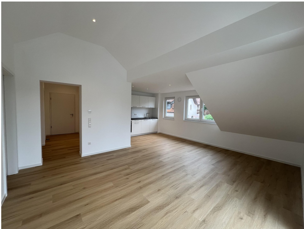
Blick Wohn- und Essbereich