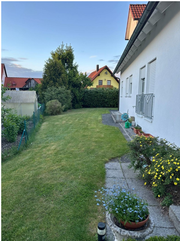
Haus Westseite 2