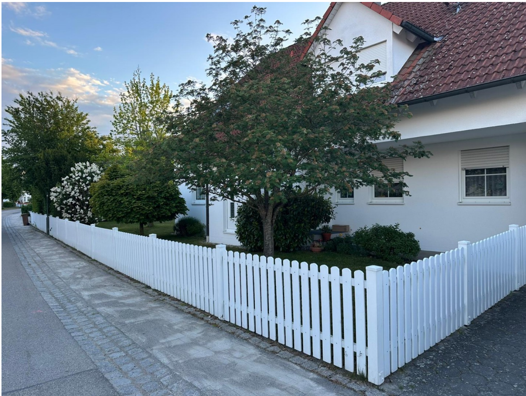
Haus Ostseite 2