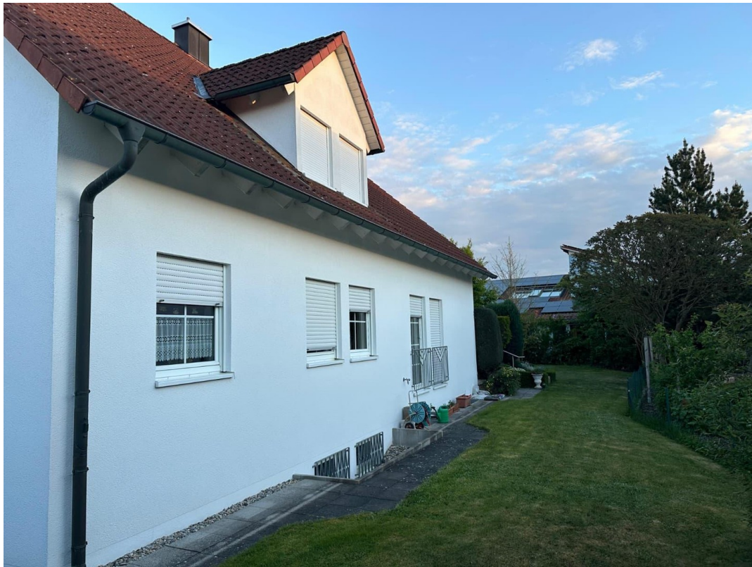
Haus Westseite 1