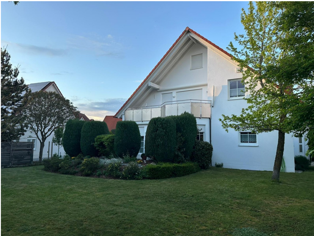
Haus Südseite 2