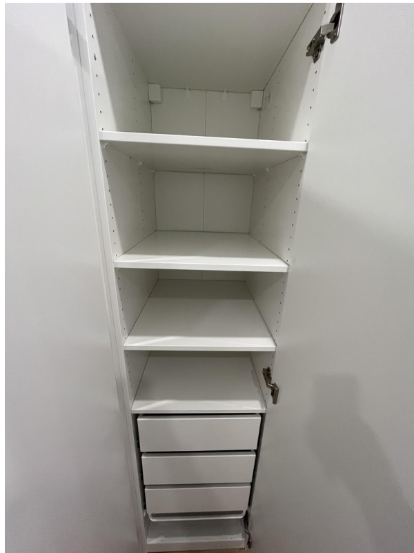
Kleiderschrank im WG Zimmer