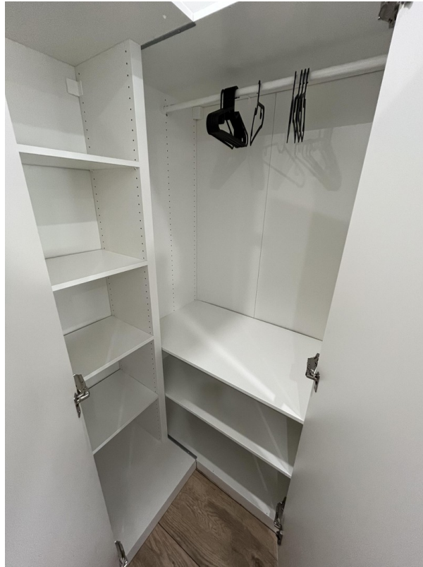
Kleiderschrank im WG Zimmer