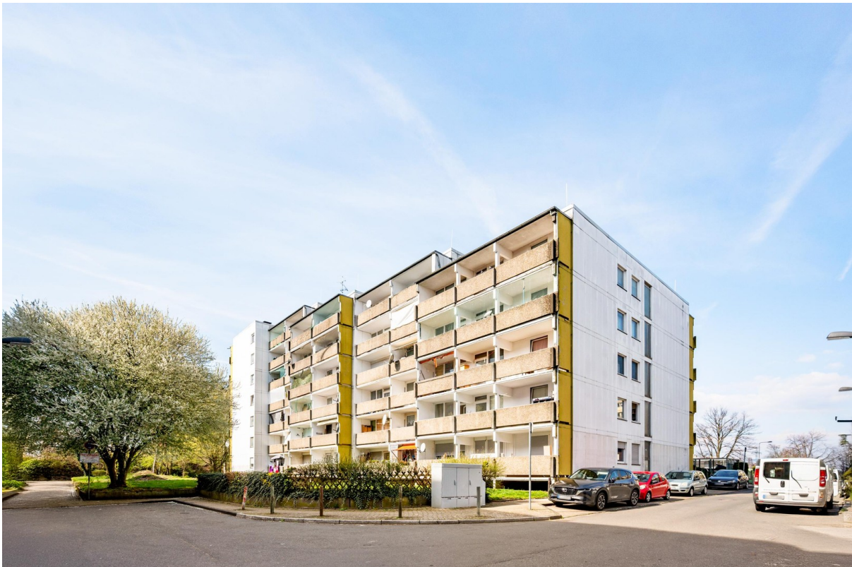
Gebäude vom Außen