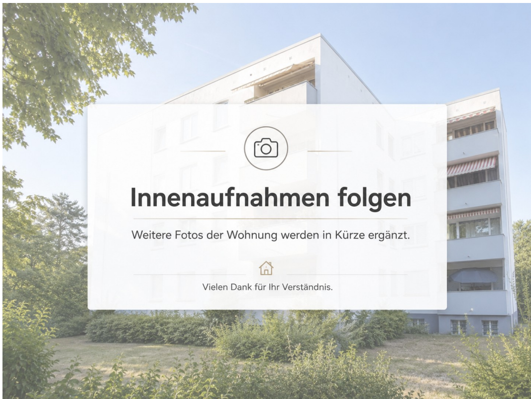
Weitere Bilder folgen