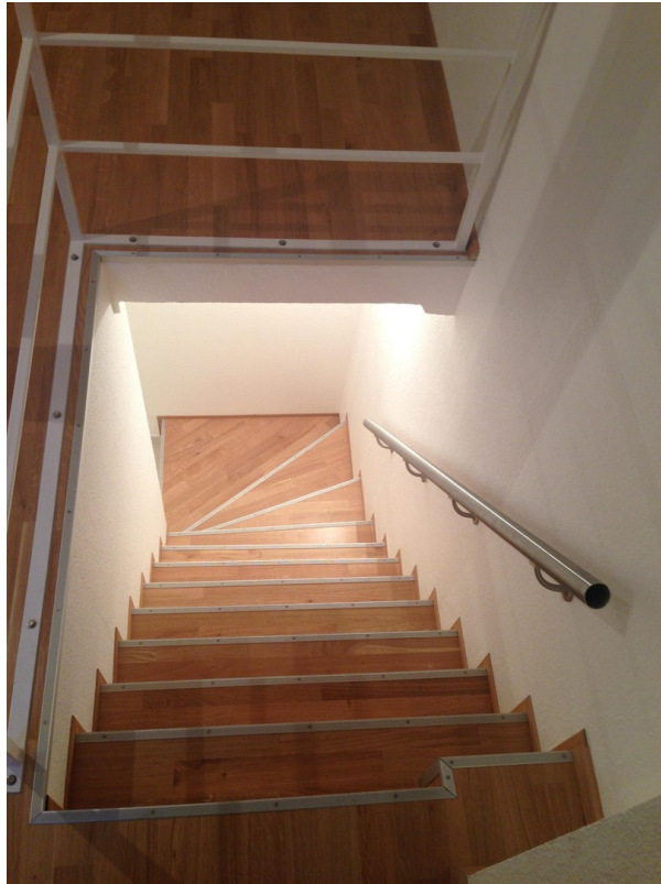
Treppe zur Schlafebene