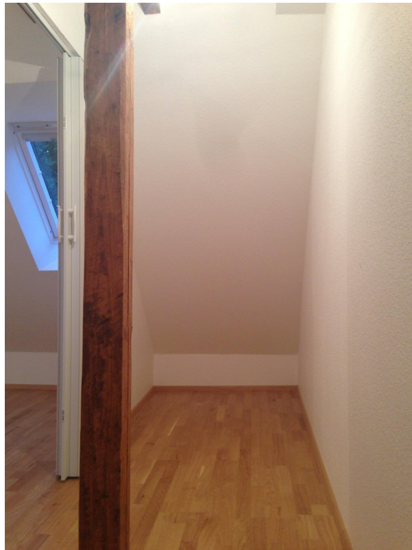
Abstellkammer auf Schlafebene