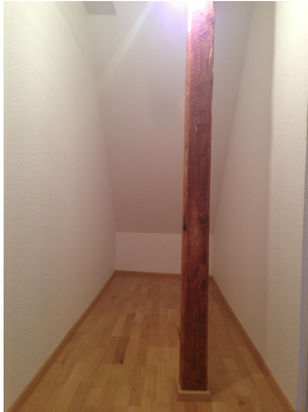
Abstellkammer auf Schlafebene