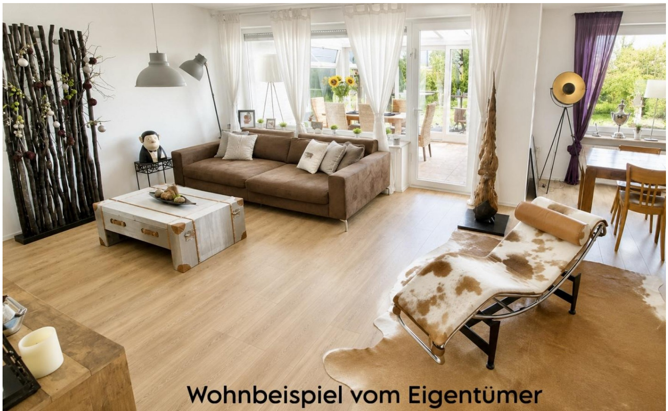
Wohnbeispiel vom Eigentümer