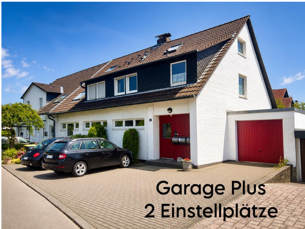
Garage Plus 2 Einstellplätze