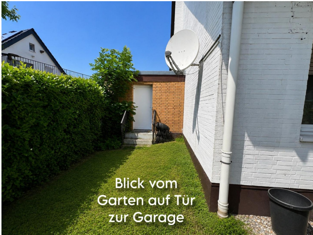
Blick vom Garten auf Tür zur Garage