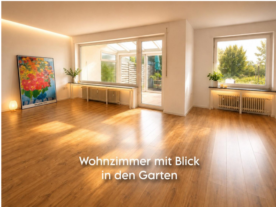
Wohnzimmer mit Blick in den Garten