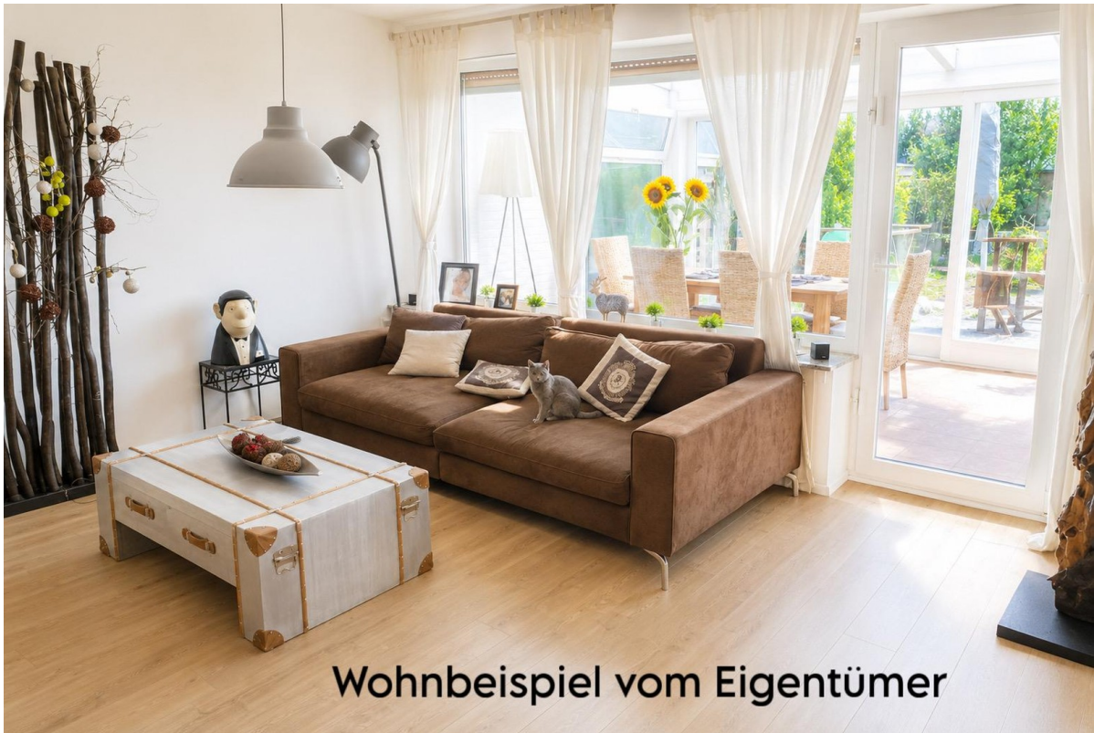
Wohnbeispiel vom Eigentümer