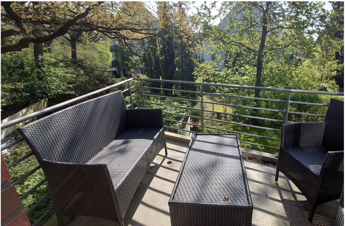
Balkon 1. OG