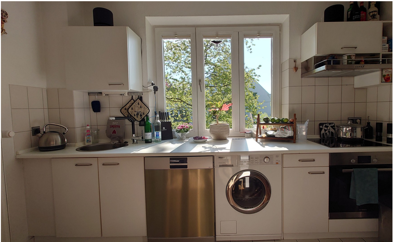
Einbauküche 1. OG