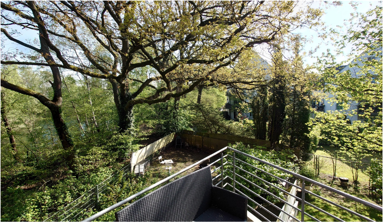
Blick vom Balkon 1. OG