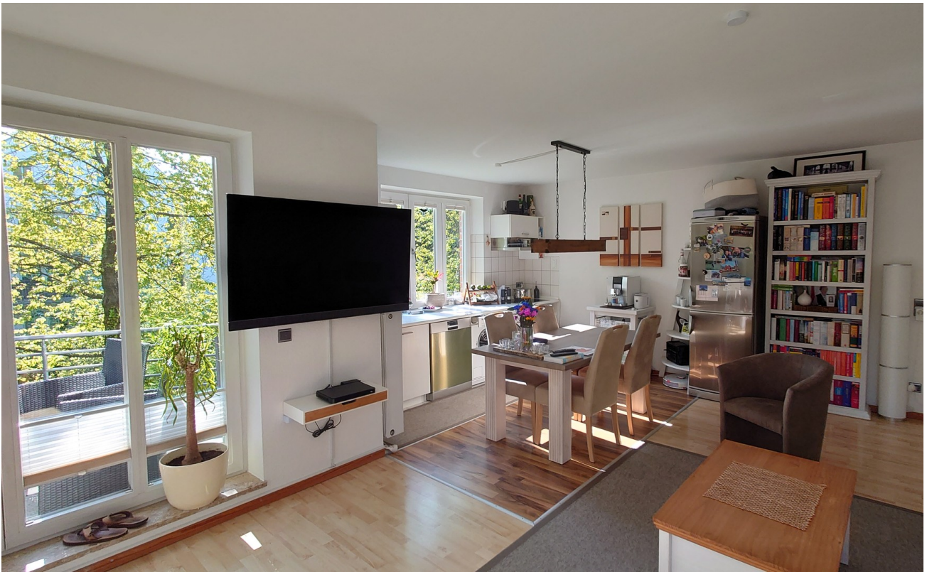
WZ mit EBK/Essbereich 1. OG