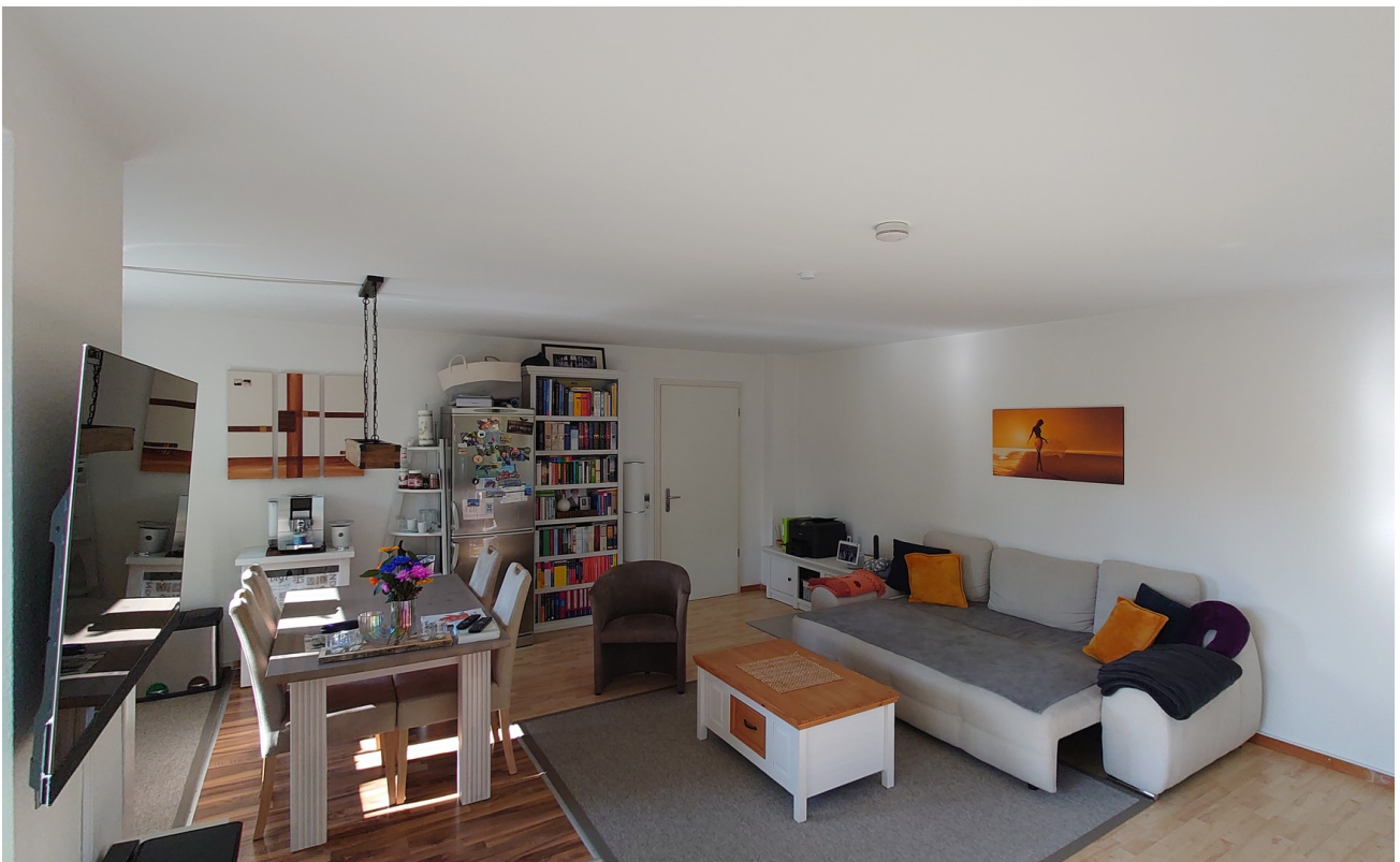
Wohnzimmer 1. OG