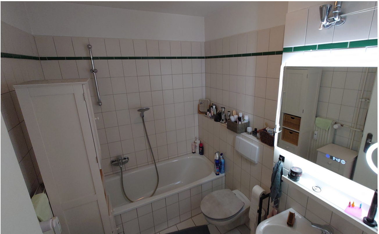
Vollbad 1. OG