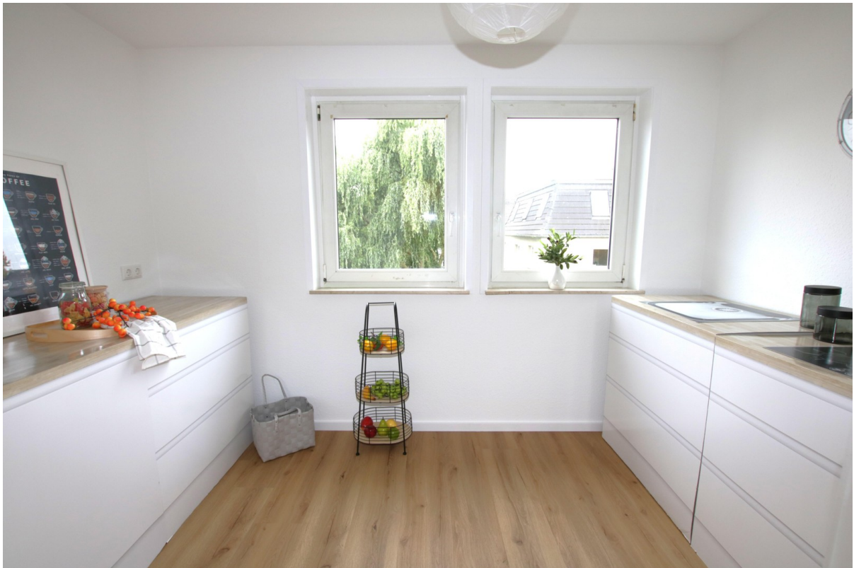
Küche - keine Möbel