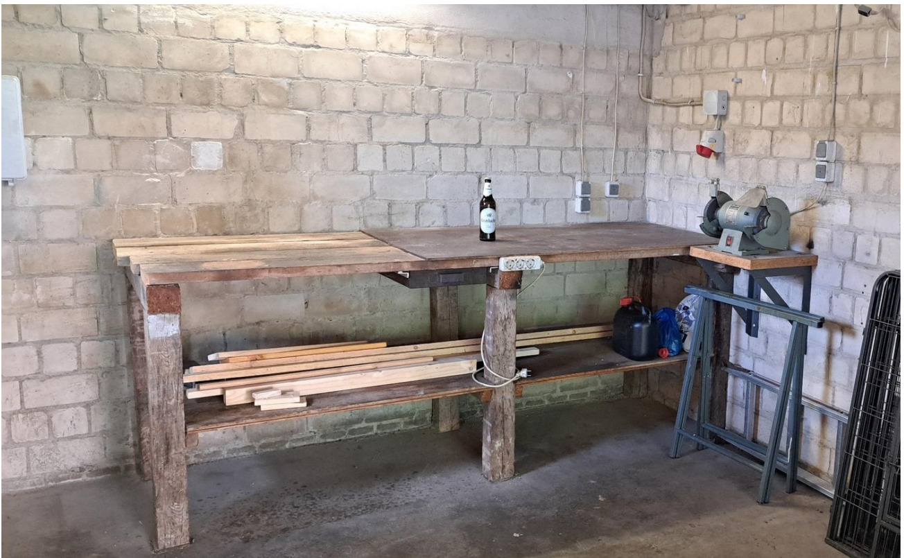
Werkbank in der Garage