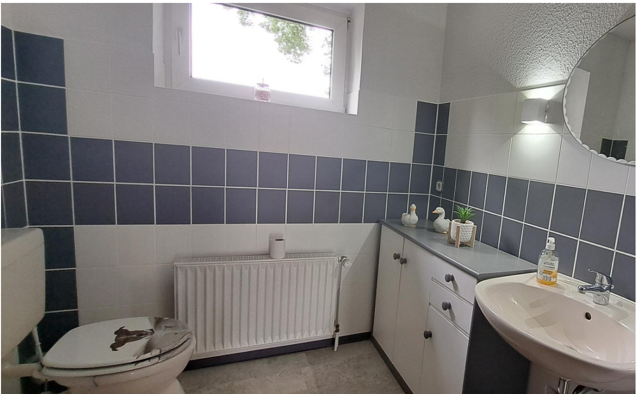
Gäste-WC im EG