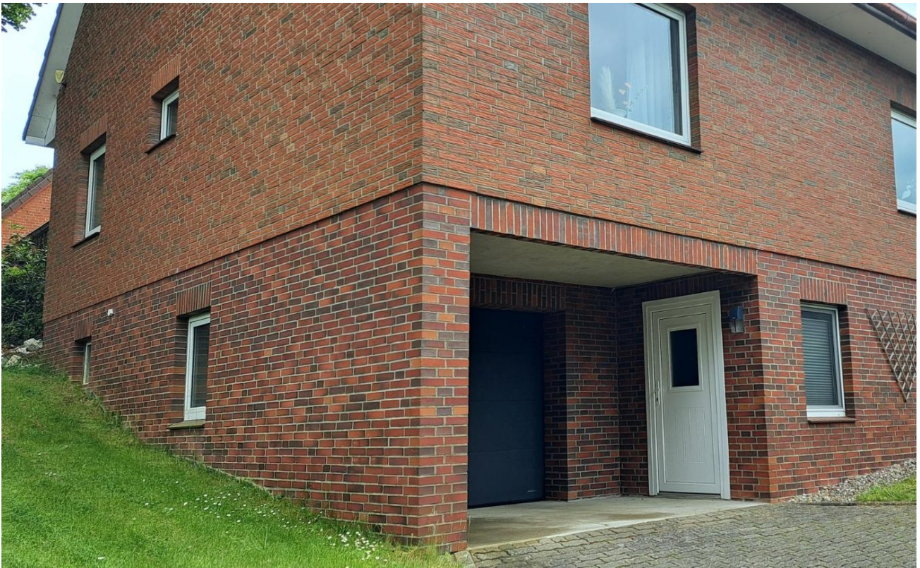
Ansicht mit Garageneinfahrt