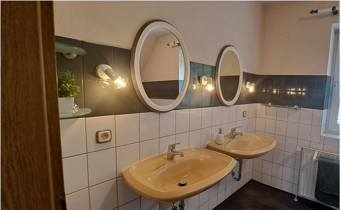
Vollbad im OG