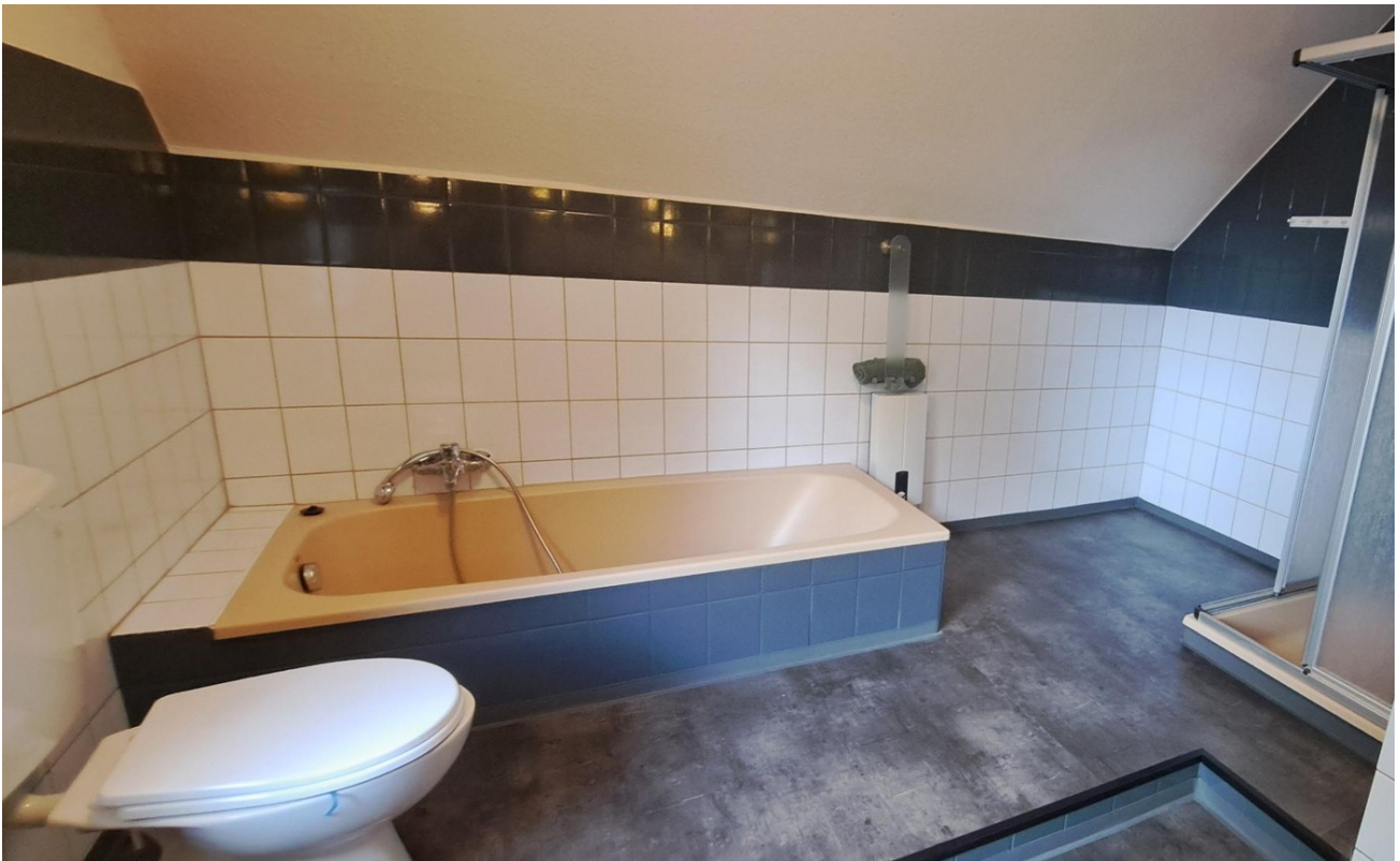
Vollbad im OG