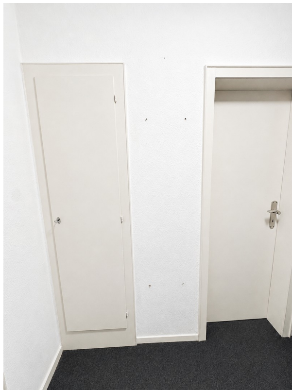
Links Abstellkammer Rechts Bad