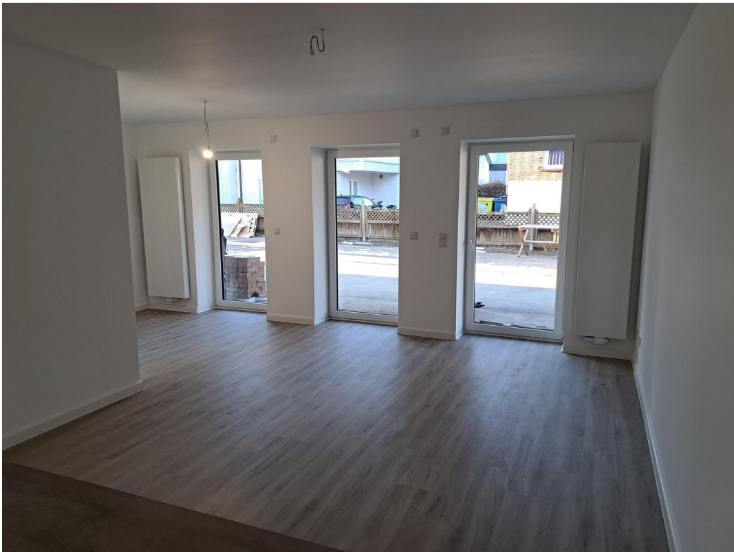
Wohnzimmer / Essen