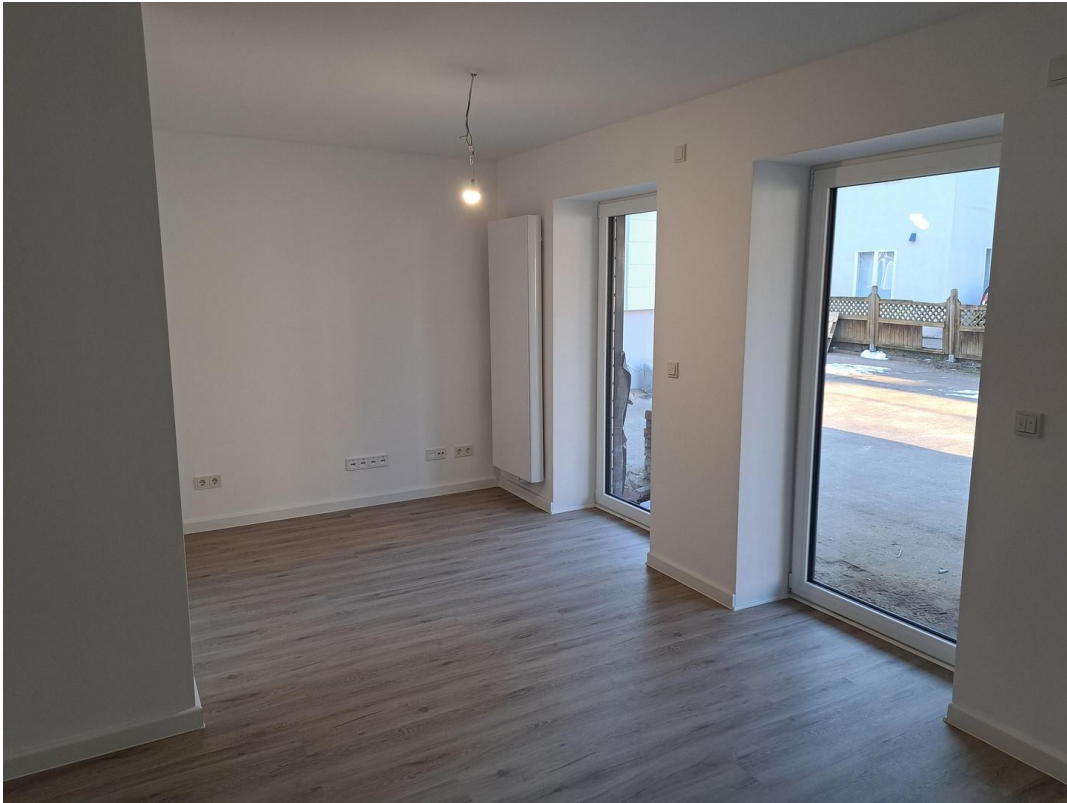
Wohnzimmer / Essen