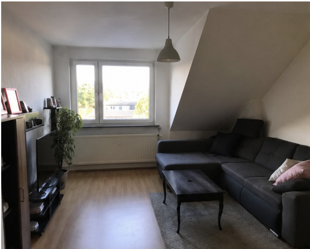
Ess- und Wohnzimmer