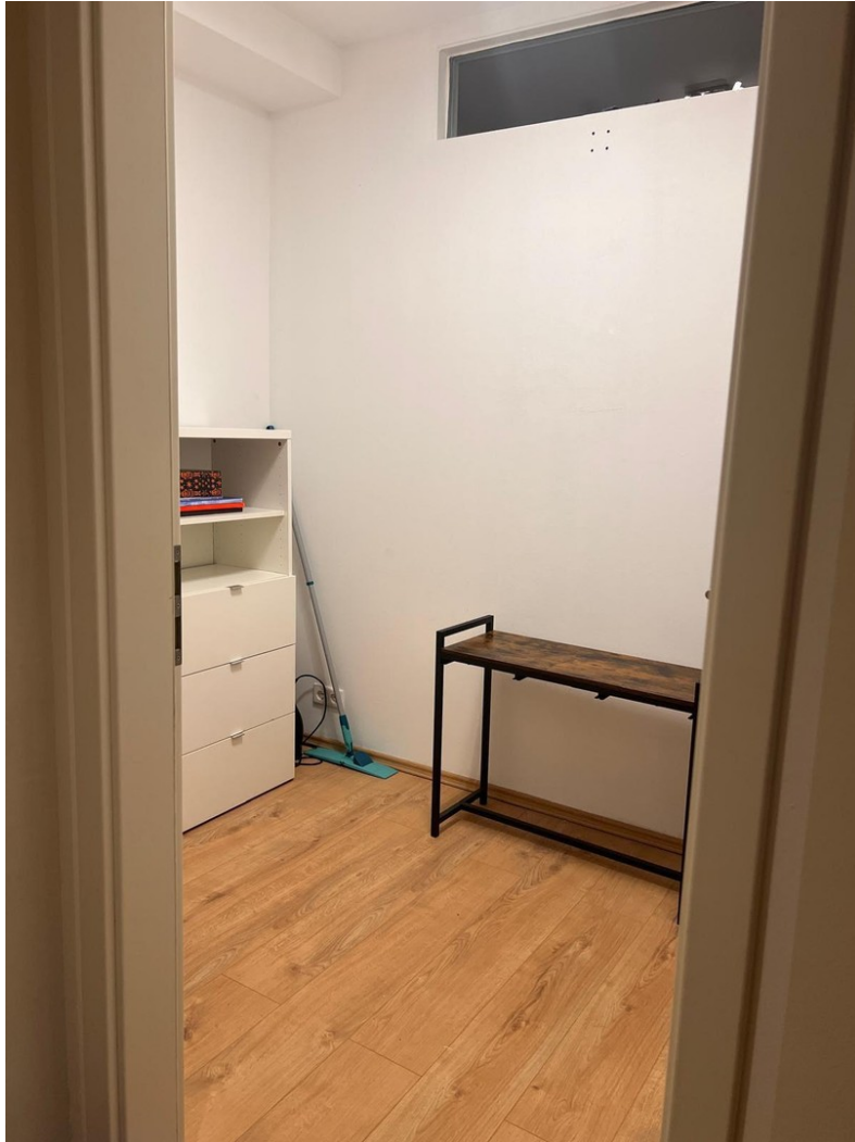
Büro / Abstellraum