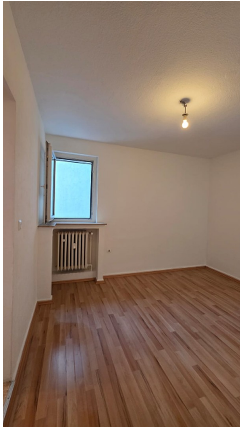
Wohn - Schlafräum