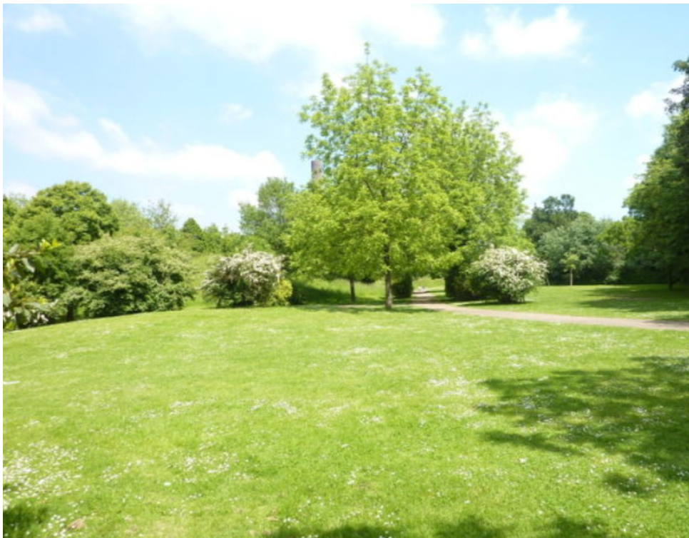
Park in der Nähe