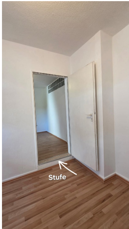
Durchgang - Stufe