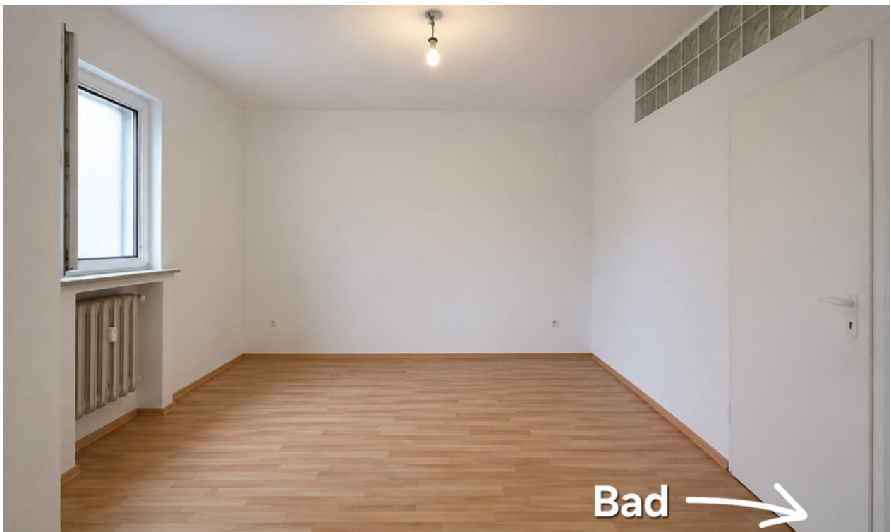
Wohn - Schlafräum