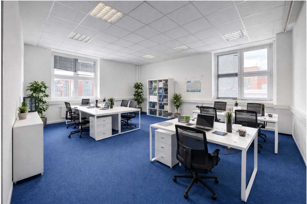
Visualisierung Büro 6