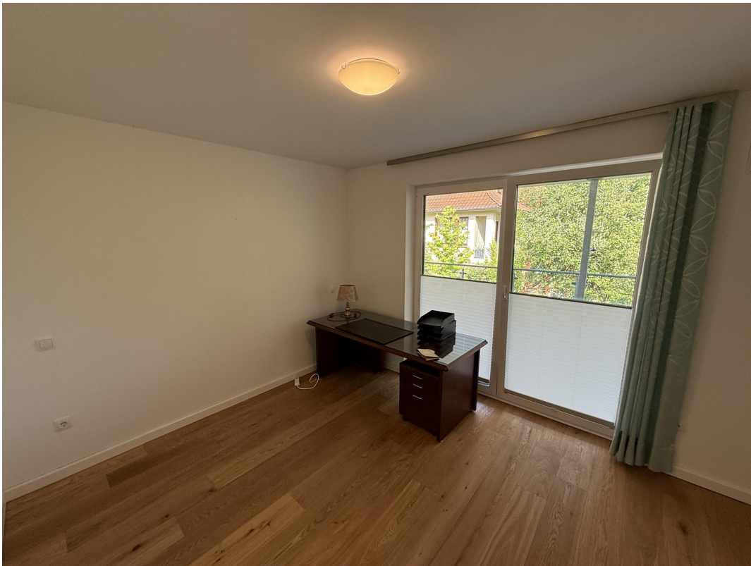
Gästezimmer / Arbeitszimmer