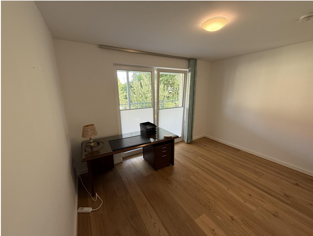
Gästezimmer / Arbeitszimmer