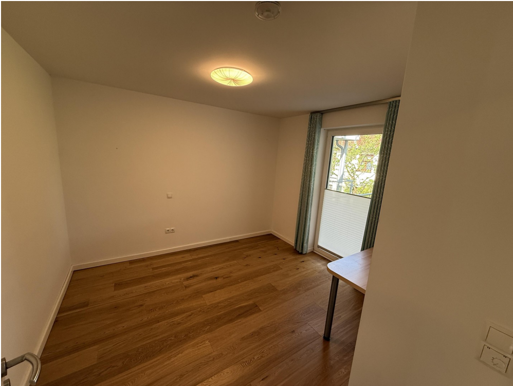
Gästezimmer / Arbeitszimmer