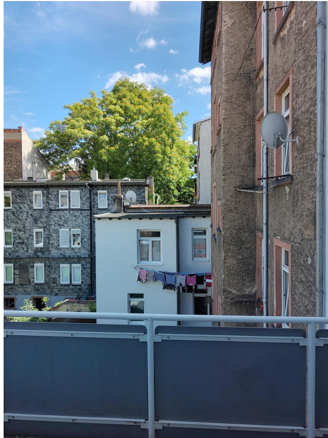
Sicht vom Balkon