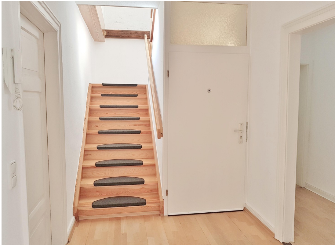
Flur mit Aufgang Atelier