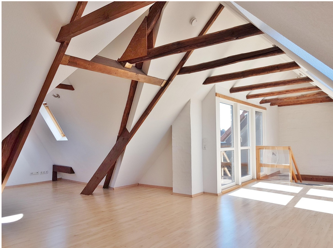
Atelier 10.30m x 6,00 x 3,05