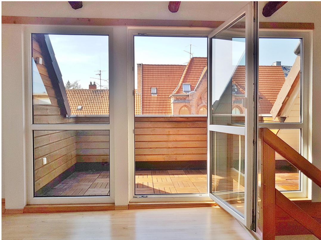
Atelier zu Dachterrasse