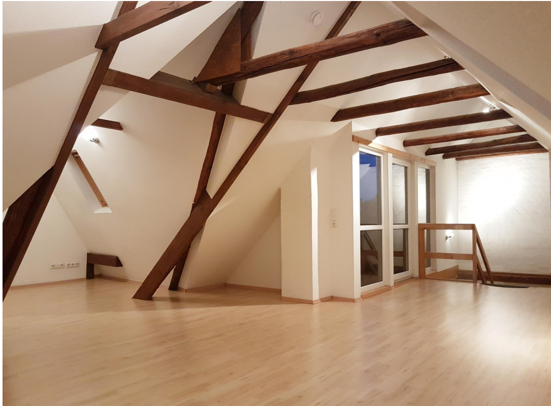
Atelier 10.30m x 6,00 x 3,05