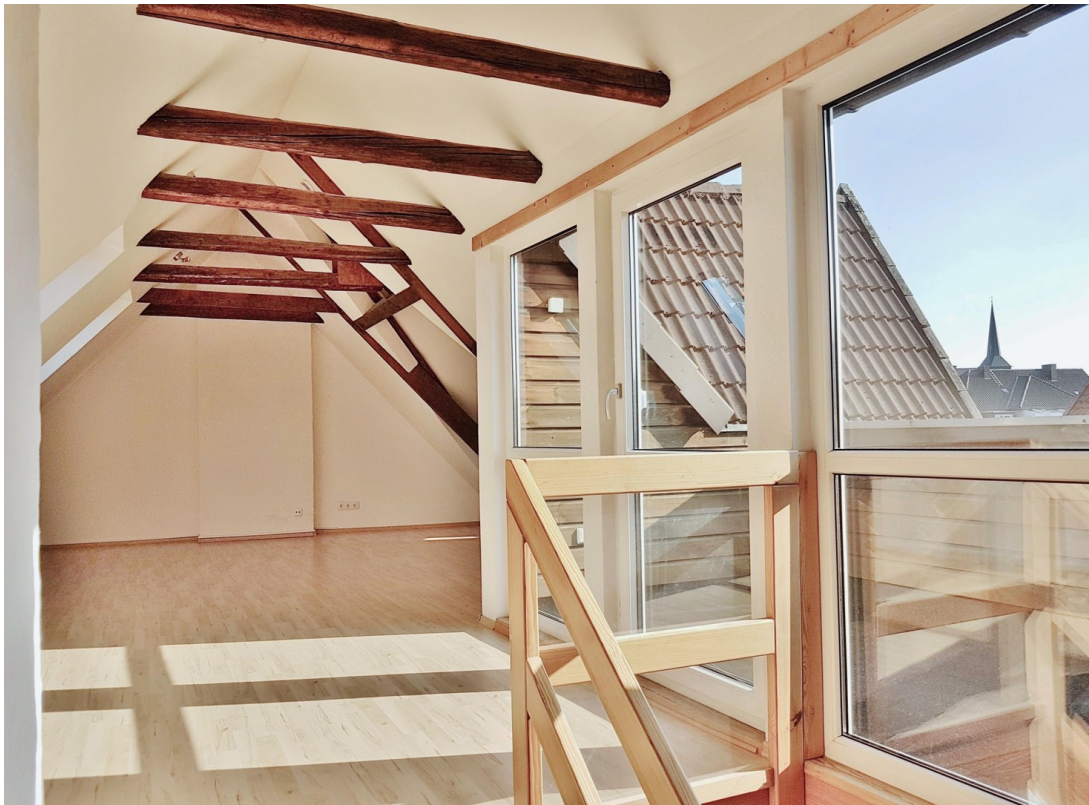
Atelier ca. 35qm Wohnfläche