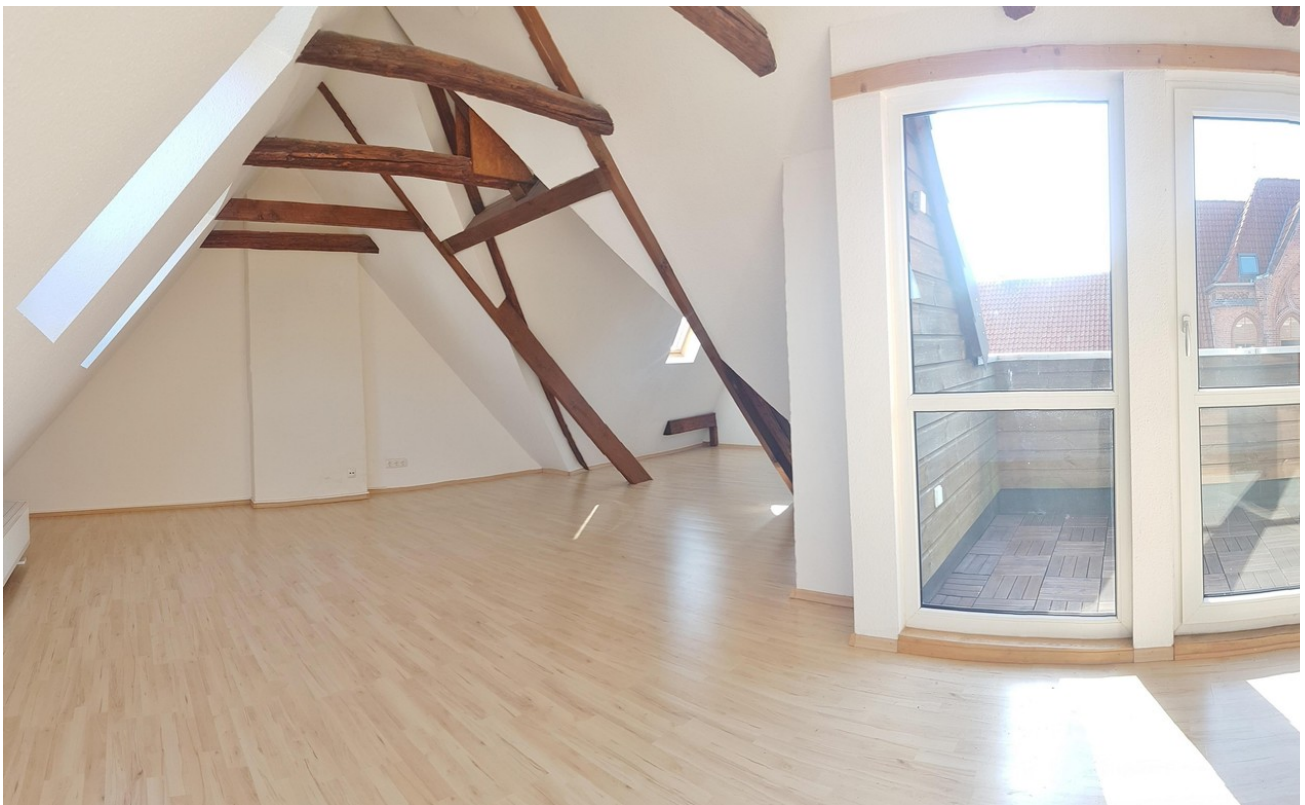
Atelier 10.30m x 6,00 x 3,05