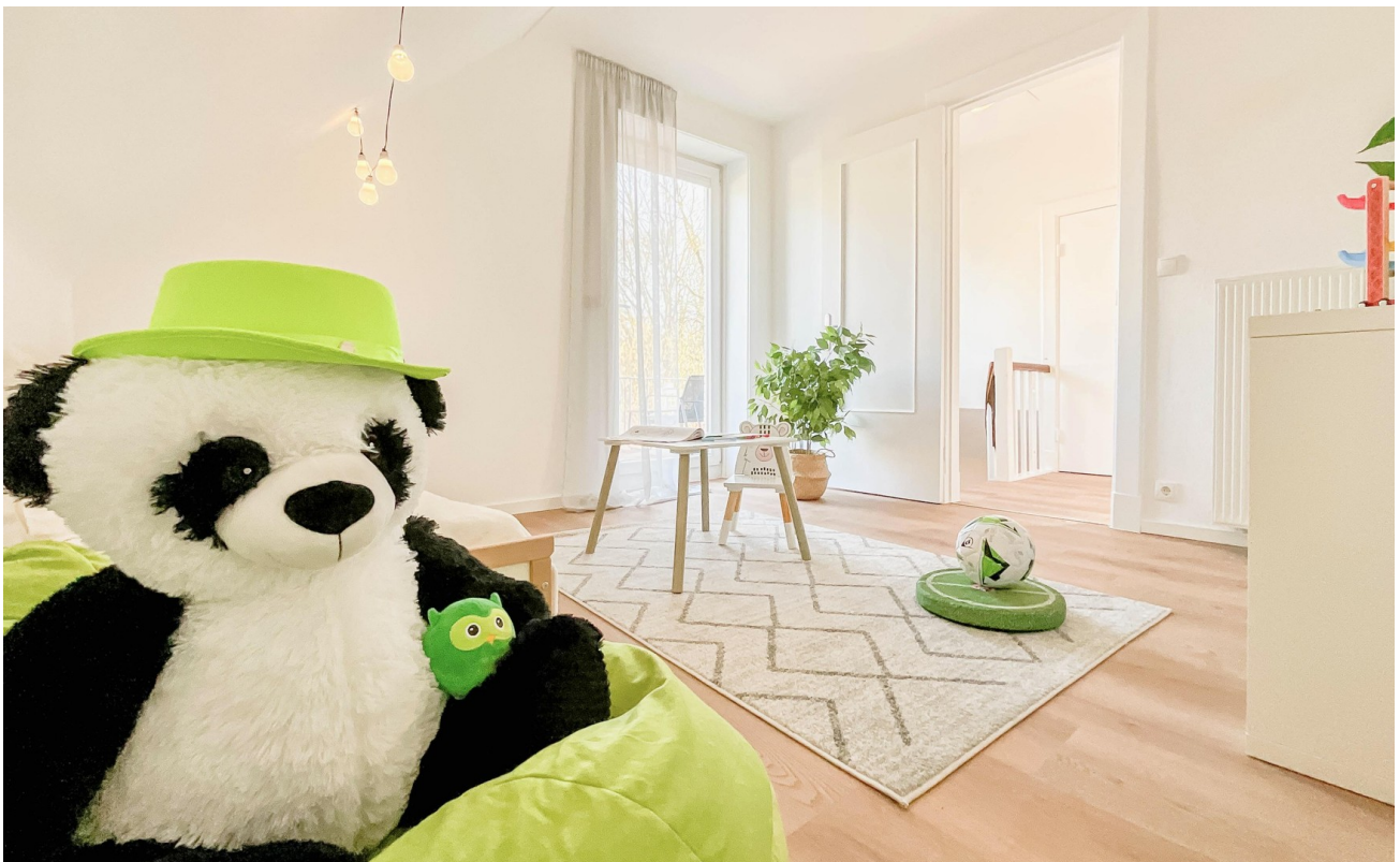
Kinderzimmer 2 OG