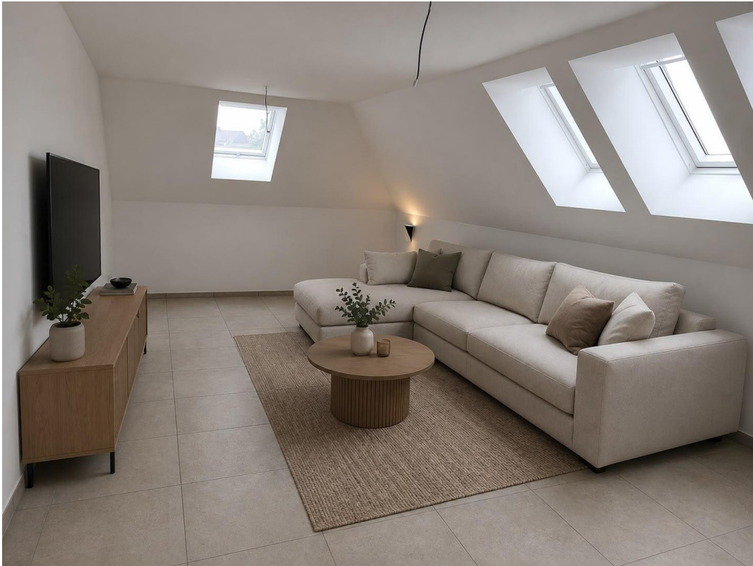
Essen/ Wohnen KI generiert