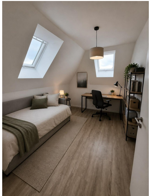
Kind/ Arbeiten KI generiert