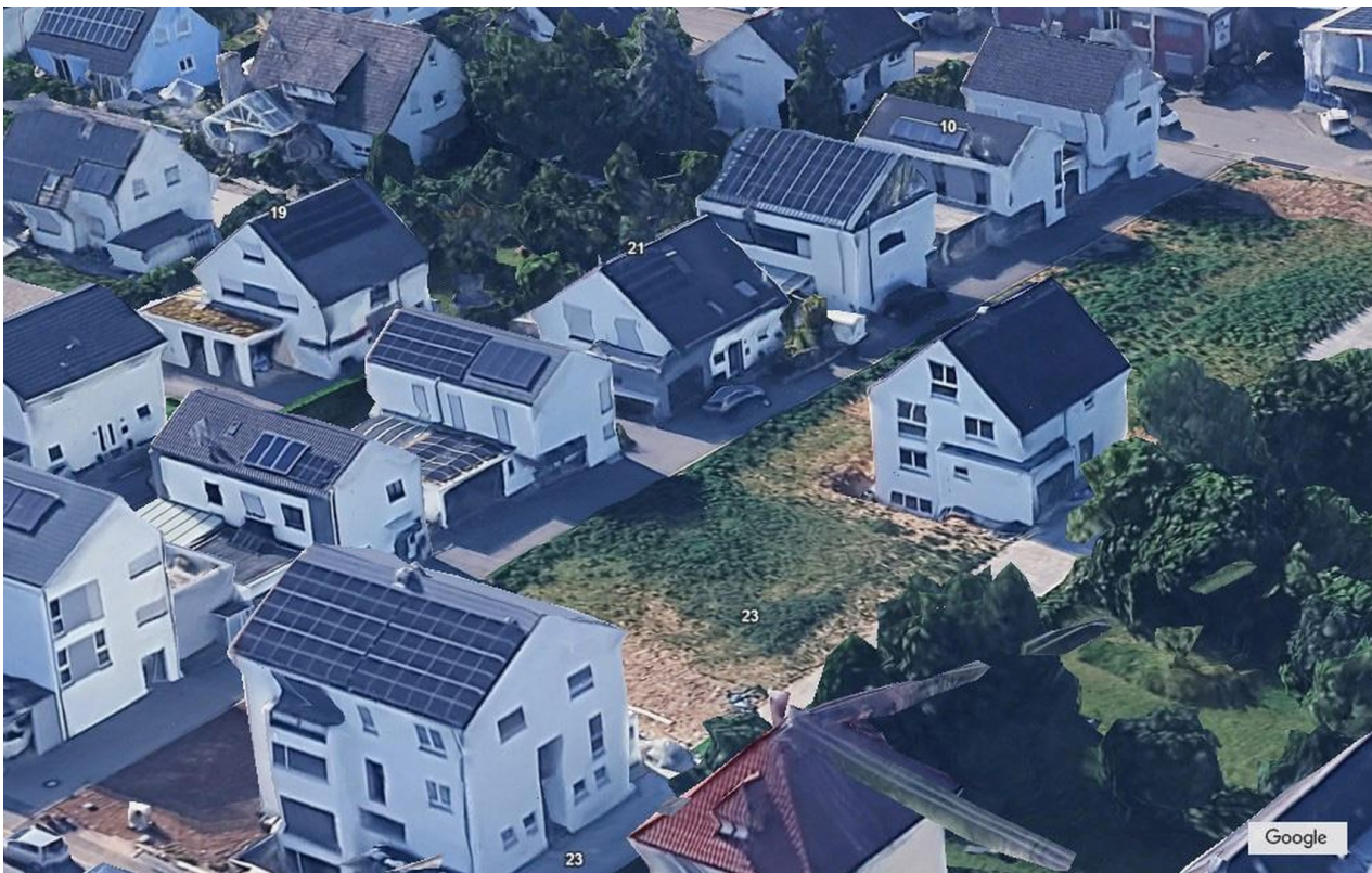
Google earth view 2