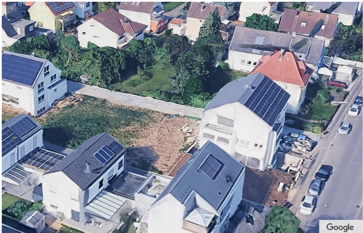
Google earth view 1