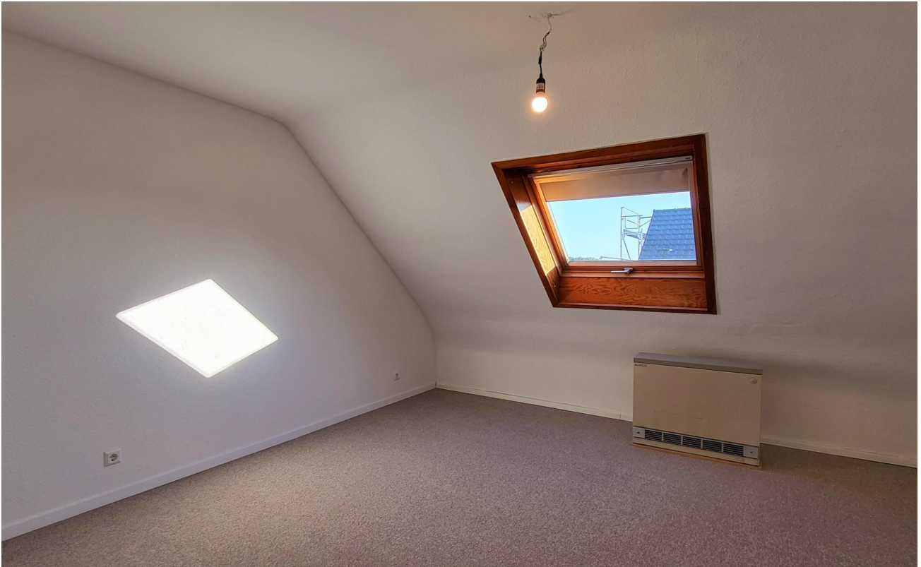
03 Schlafzimmer 1