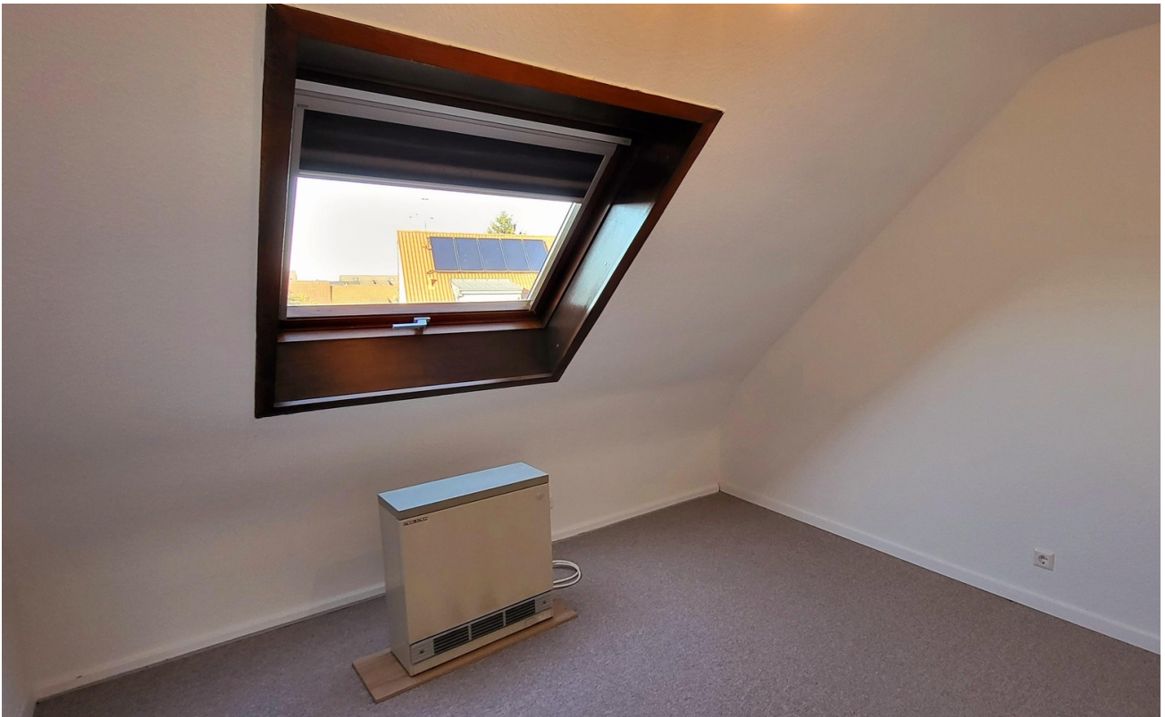
04 Schlafzimmer 2