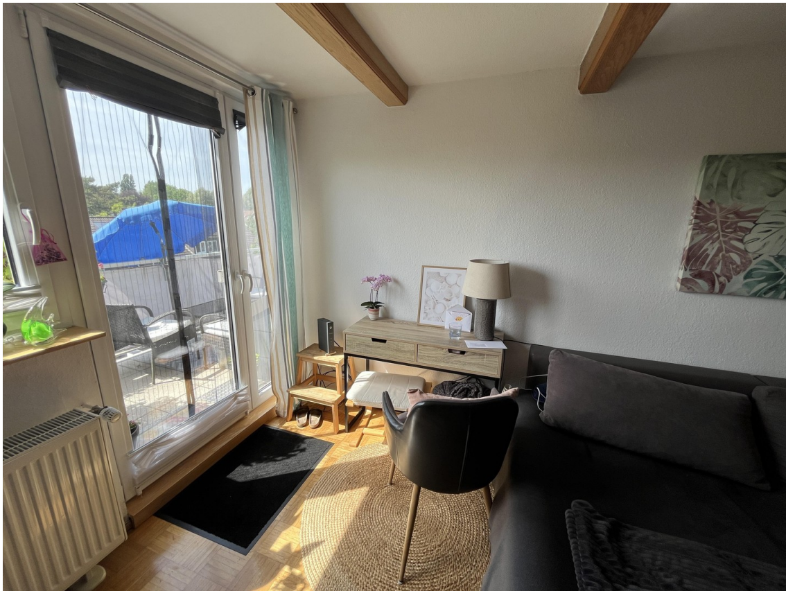
Blick WZ Balkon