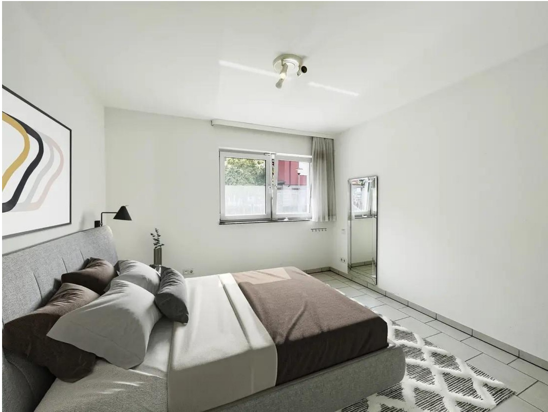
Schlafzimmer - Design Idee