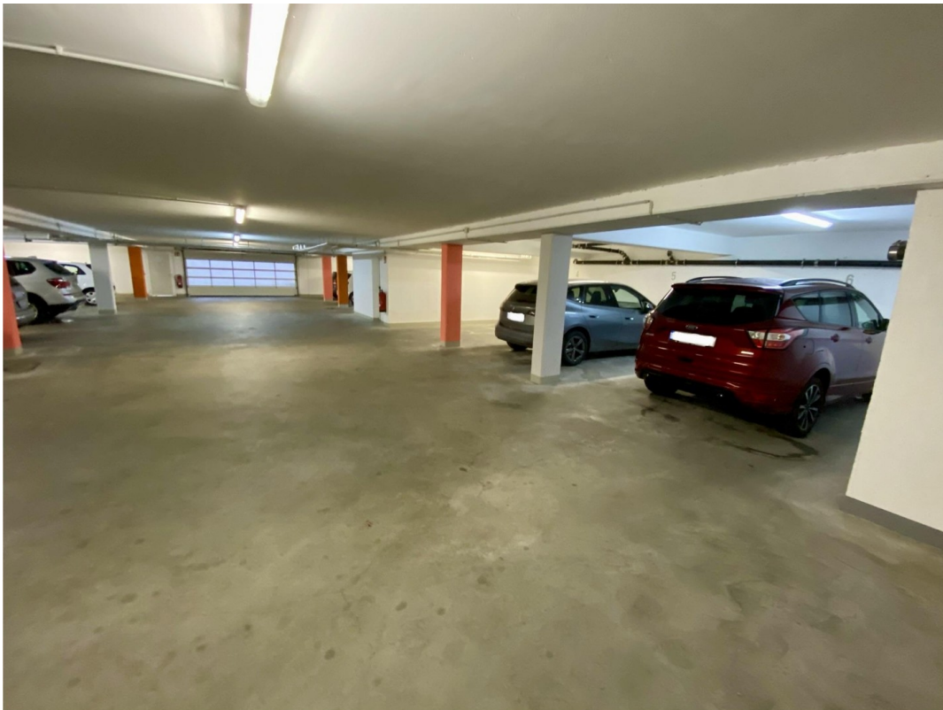
Tiefgarage - Optional