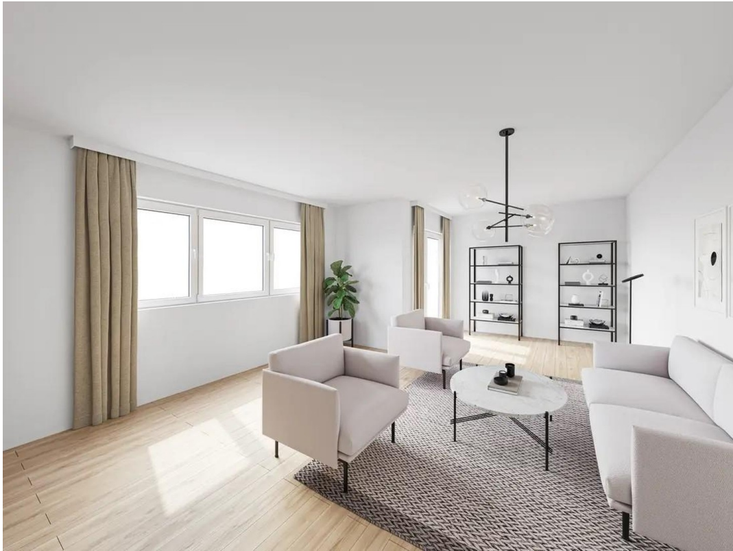
Wohnzimmer - Design Idee