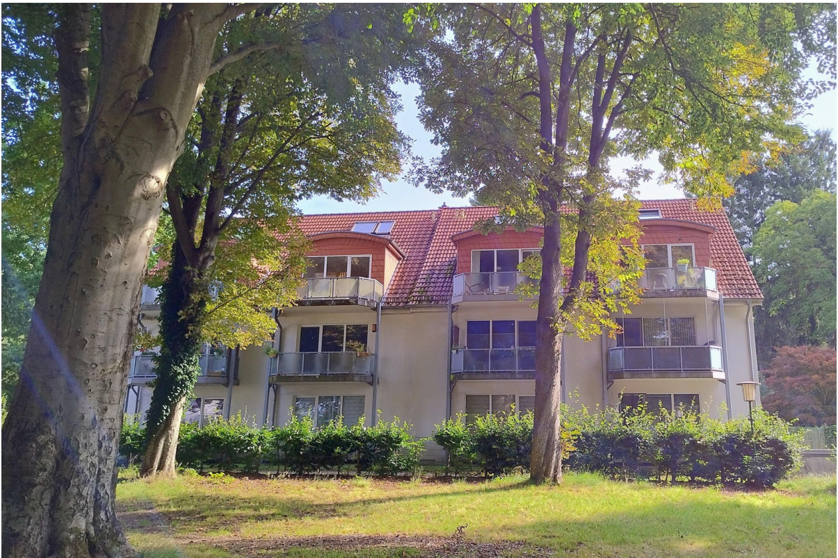
Park vis a vis der Wohnanlage