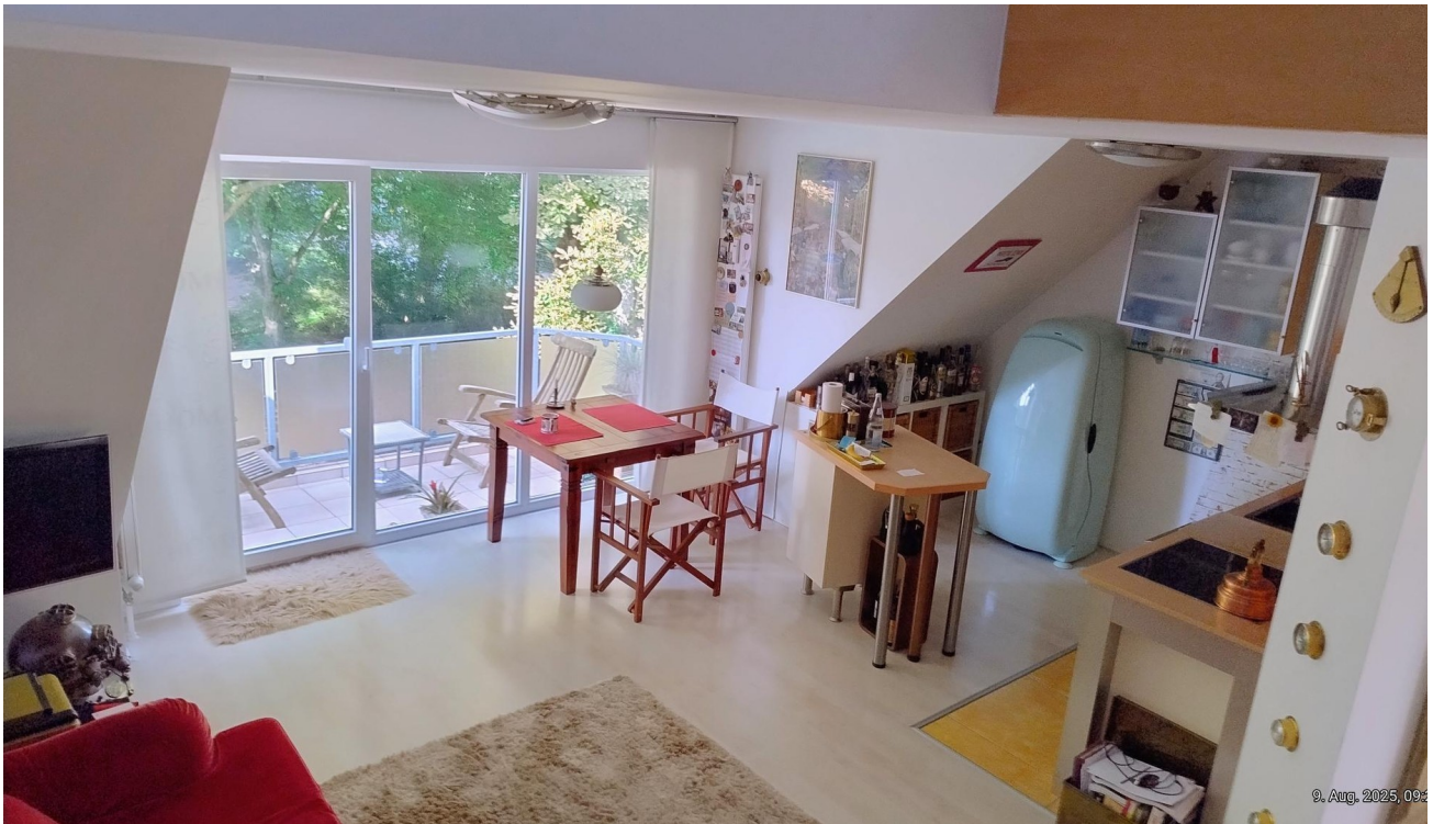
Küchenbereich mit Ausblick