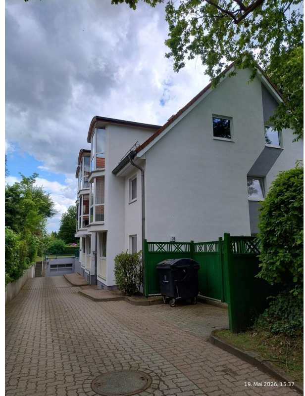
Einfahrt - Zugang TG / Whng.