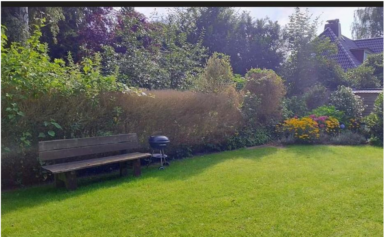
Garten mit Sitzbank