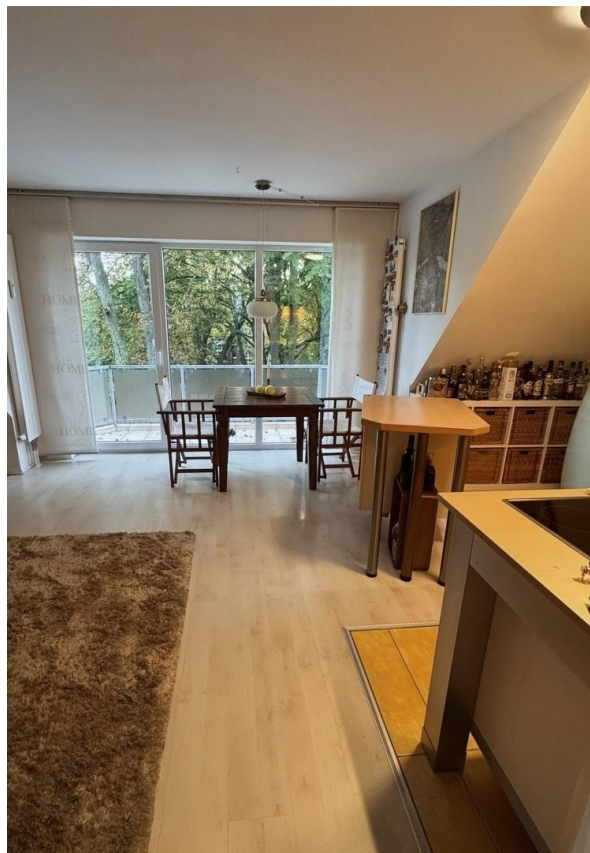
Wohn- und Küchenbereich