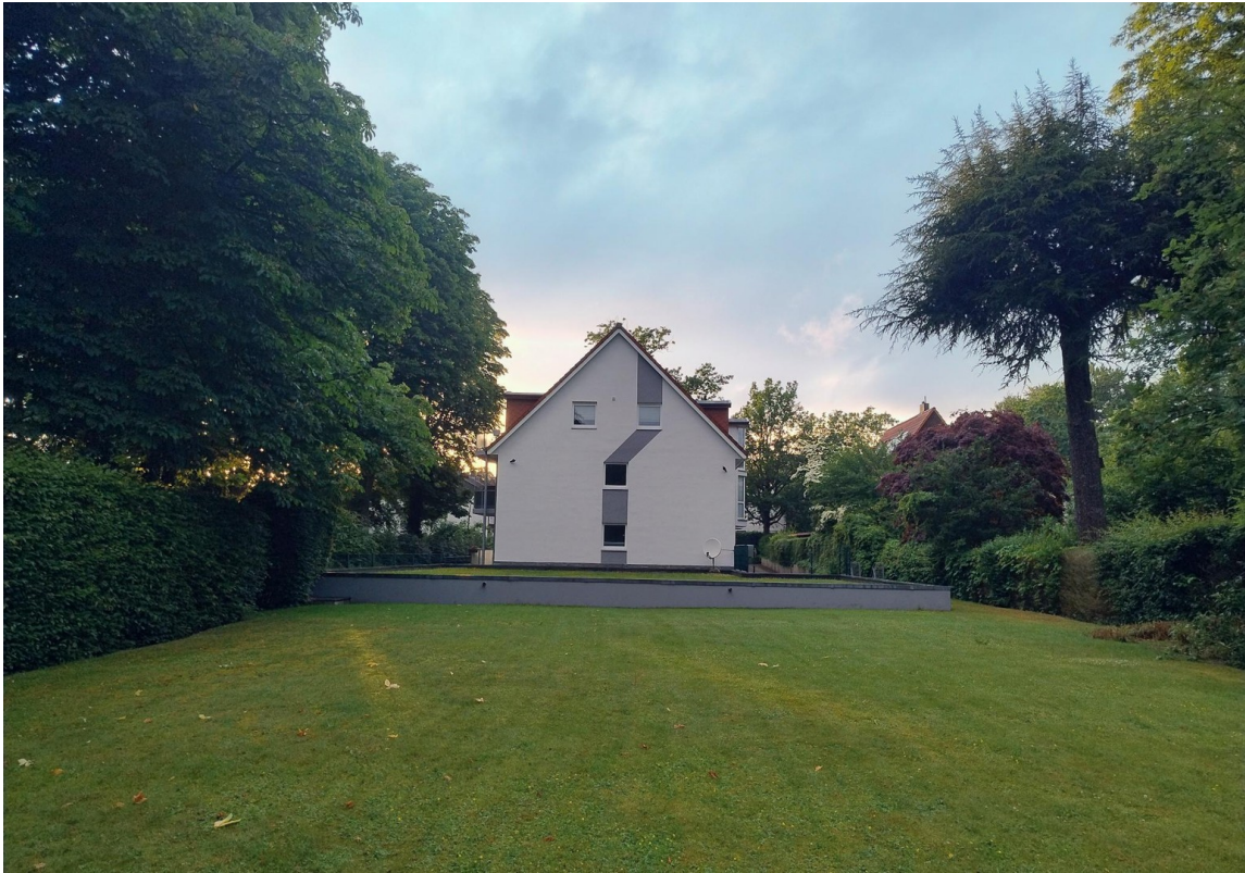
Grundstück mit Garten