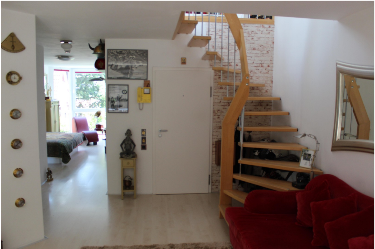
Wohnbereich mit Treppe