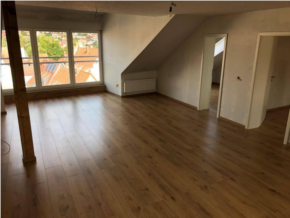
Wohnzi 4.OG vor Fertigstellung