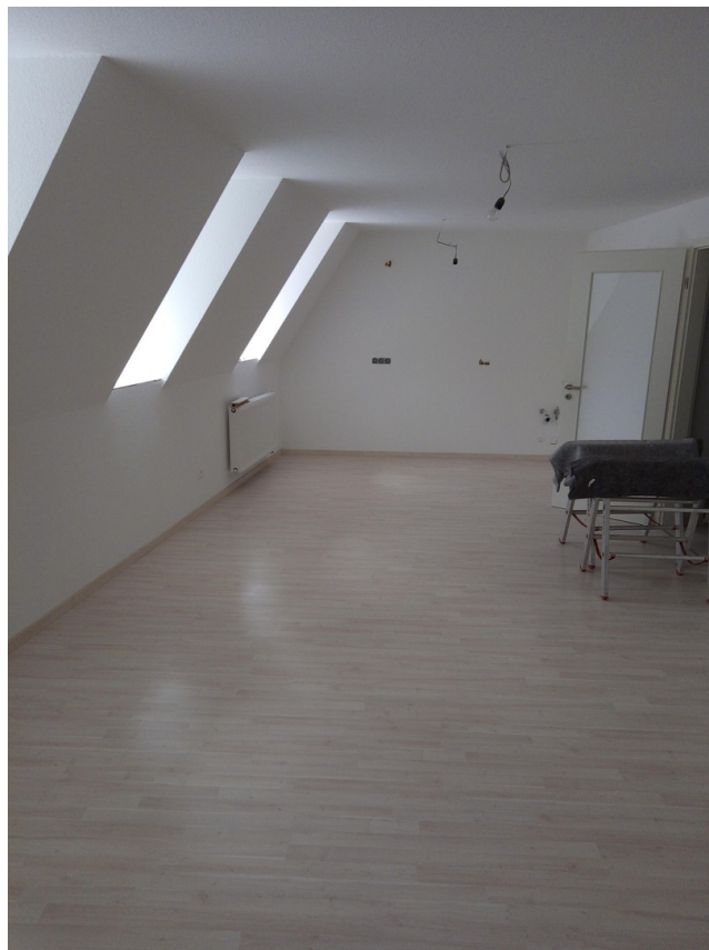
Wohnzi 3.OG vor Fertigstellung