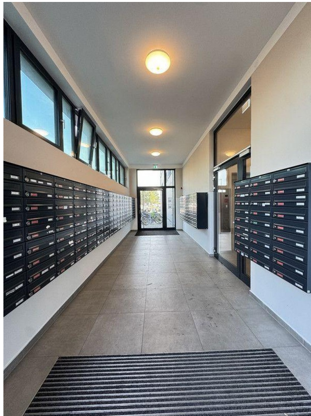
Hauseingang / Briefkästen