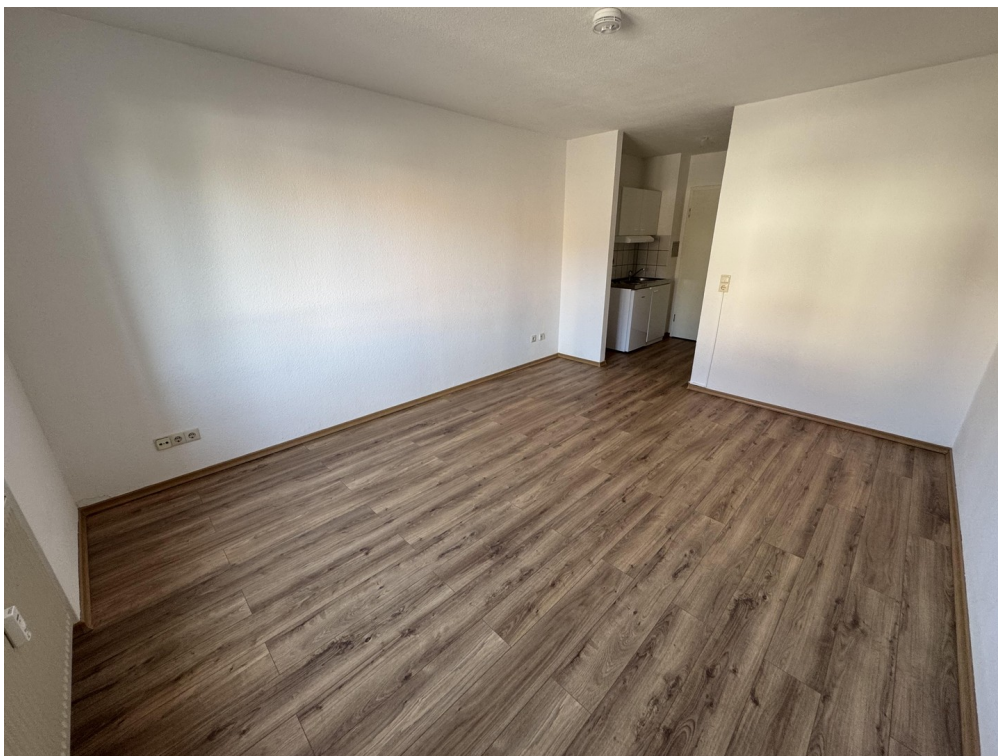
Wohnraum mit Pantryküche