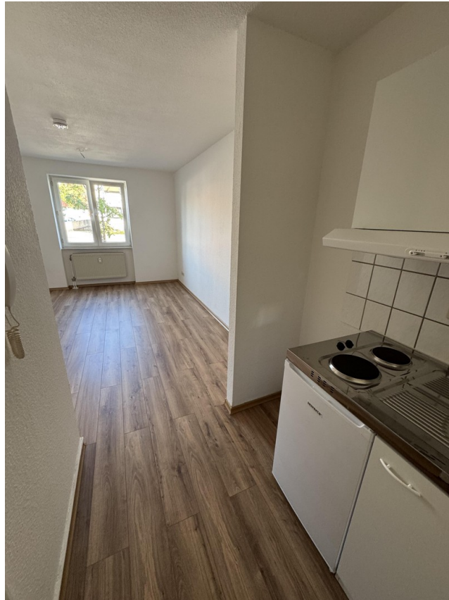
Wohn-Schlafzimmer mit Küche