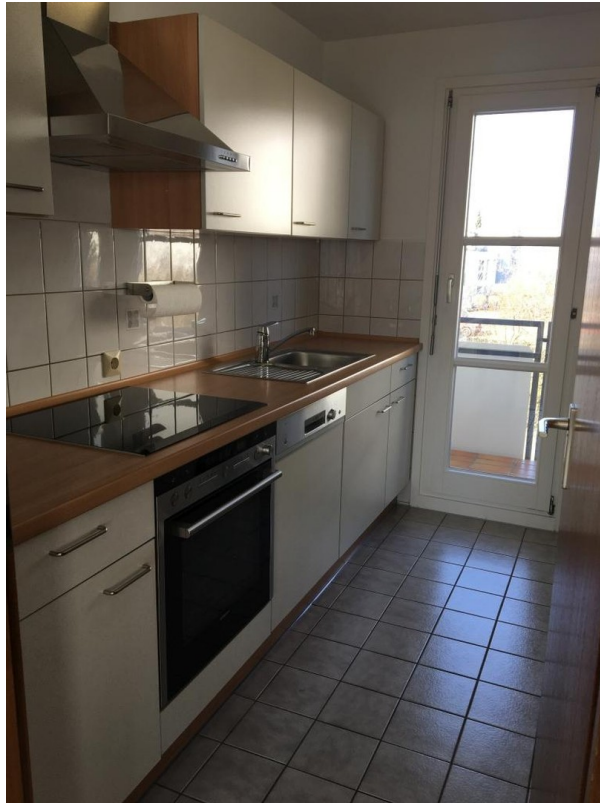
Küche mit Loggia