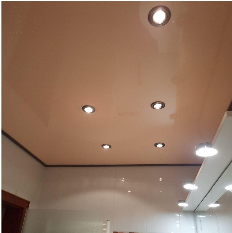
Lackleuchtdecke im Bad