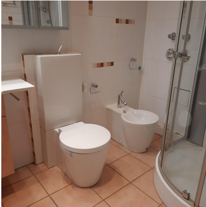
Bad mit Bidet