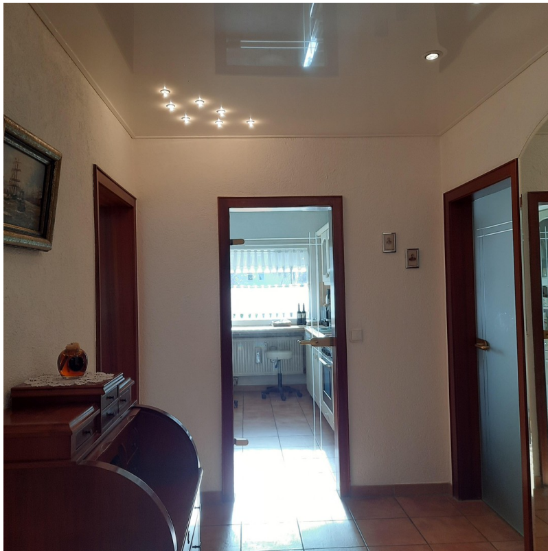
Foyer mit Lackleuchtdecke