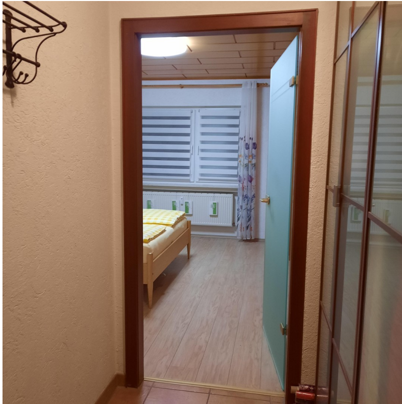
kleiner Flur zum Schlafzimmerr