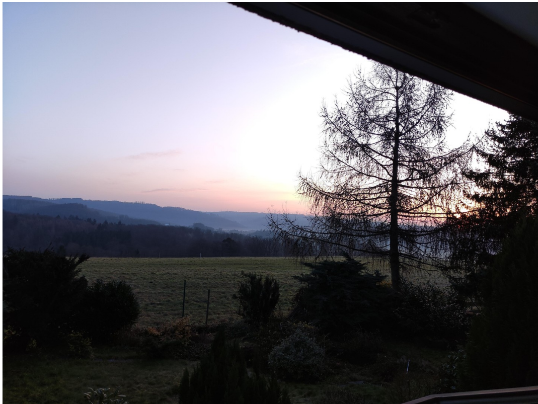
Sonnenaufgang/Blick ü. Taunus