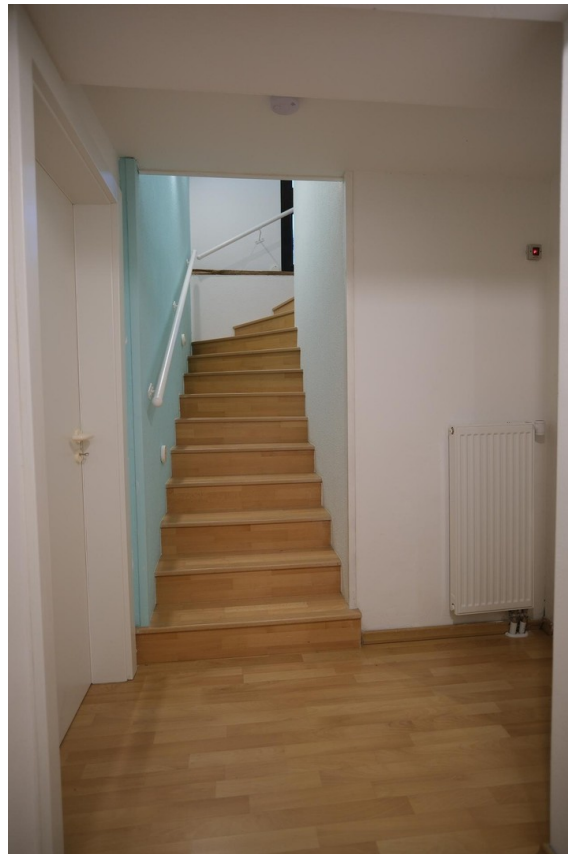
Treppe zum Keller