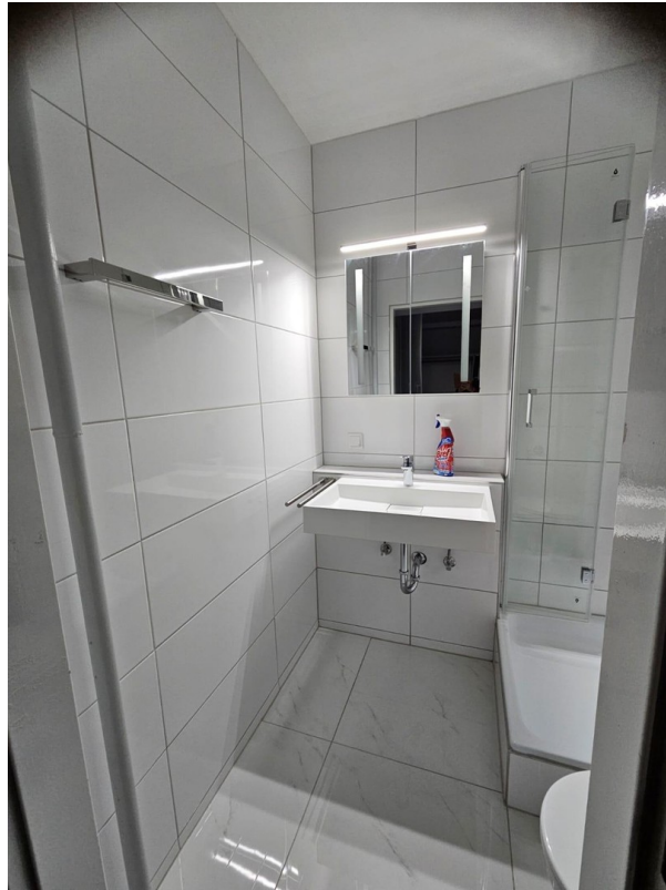
Bad mit Toilette un Dusche