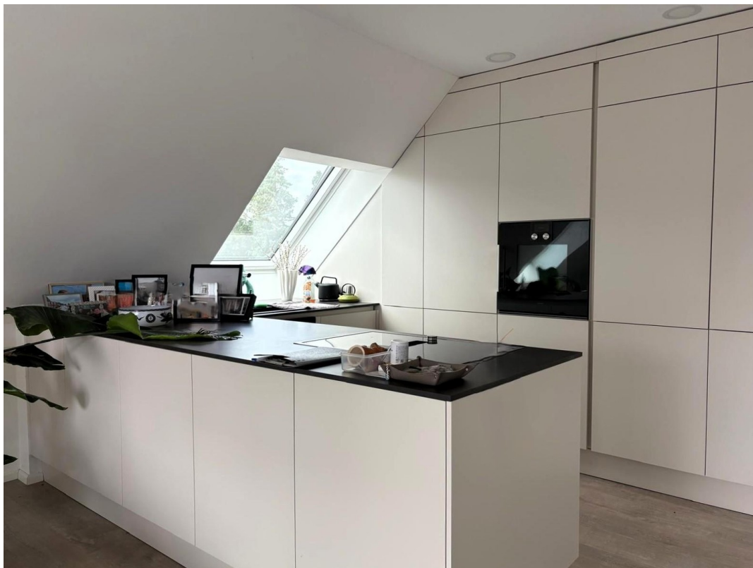
Küche (gg Abstand)