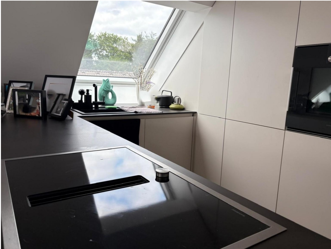
Küche (gg Abstand)