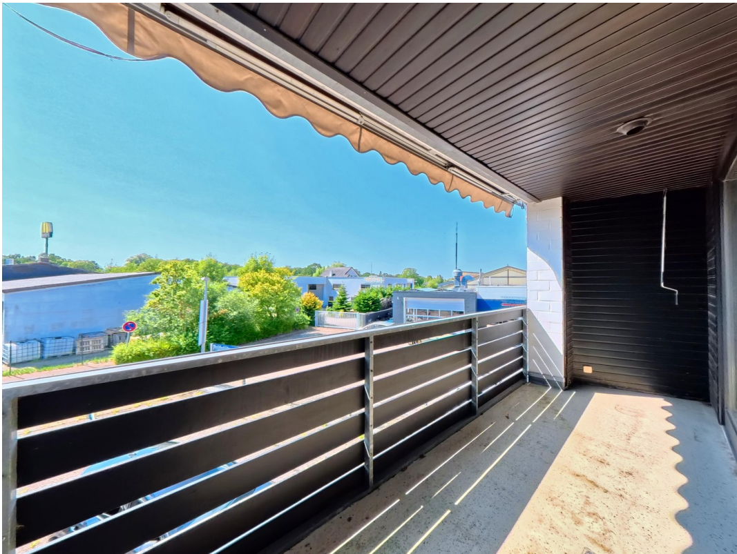
Balkon 1. OG