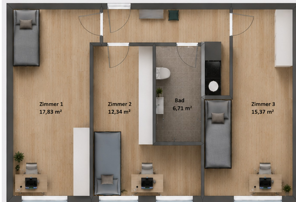
GRUNDRISS MÖBLIERT – 3-ZIMMER-WG