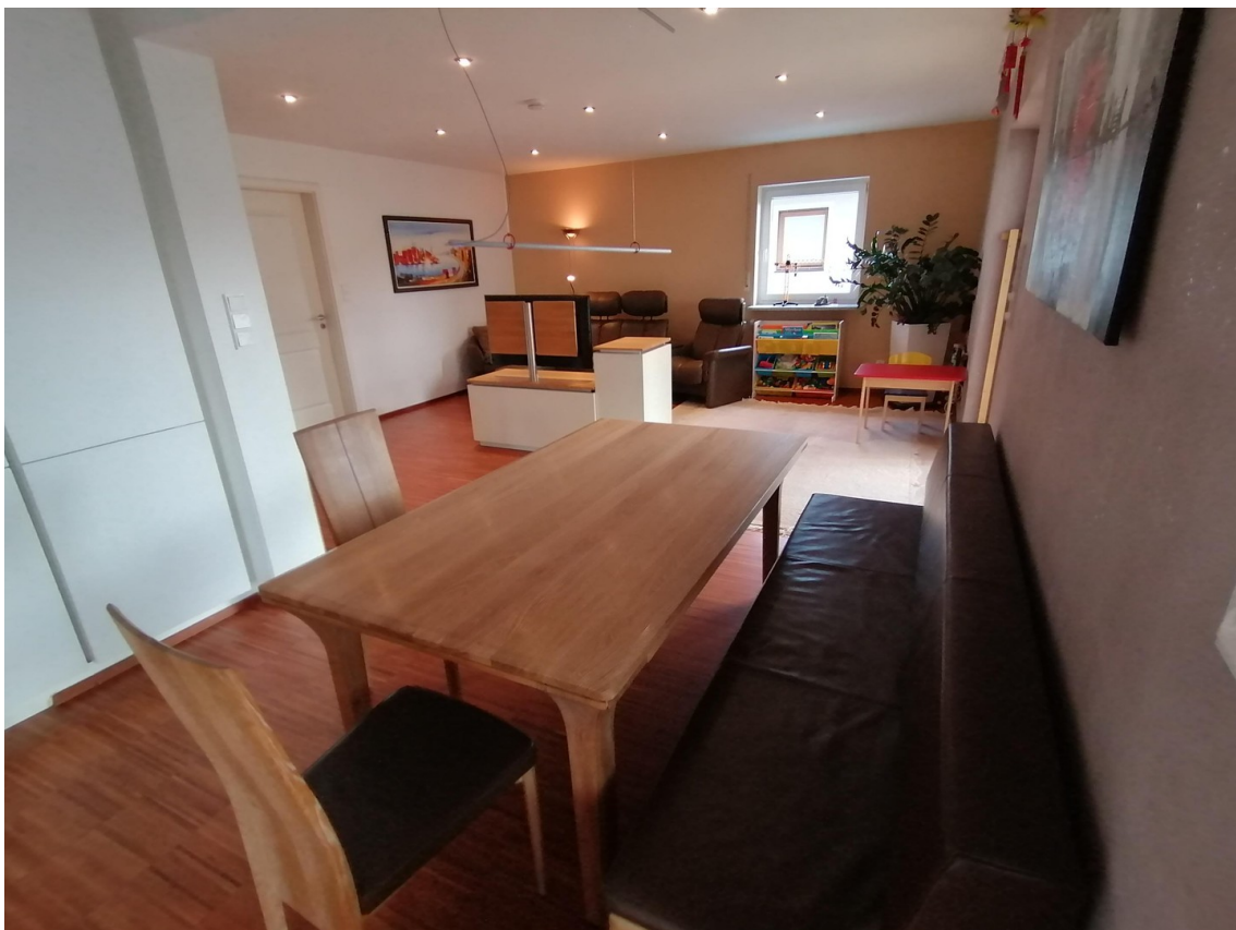
Essbereich und Wohnzimmer