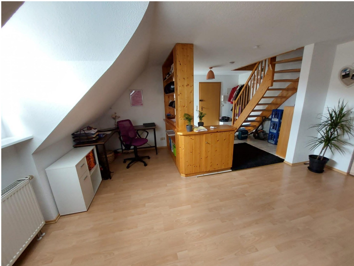
Wohnzimmer mit Arbeitsplatz