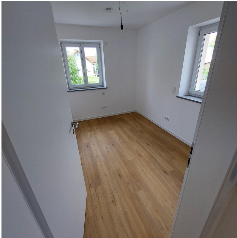
Büro oder Kind