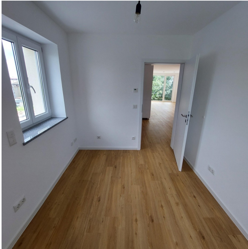
Büro oder Kind