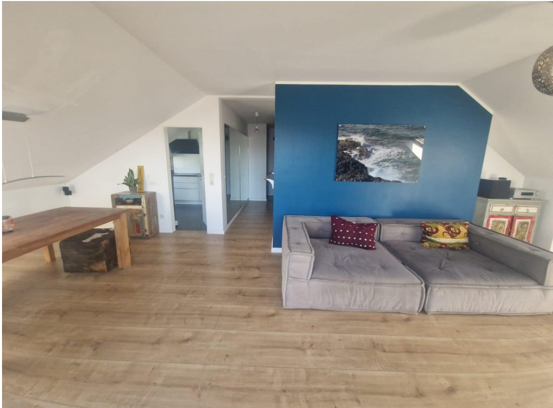
Panorama Wohnzimmer I