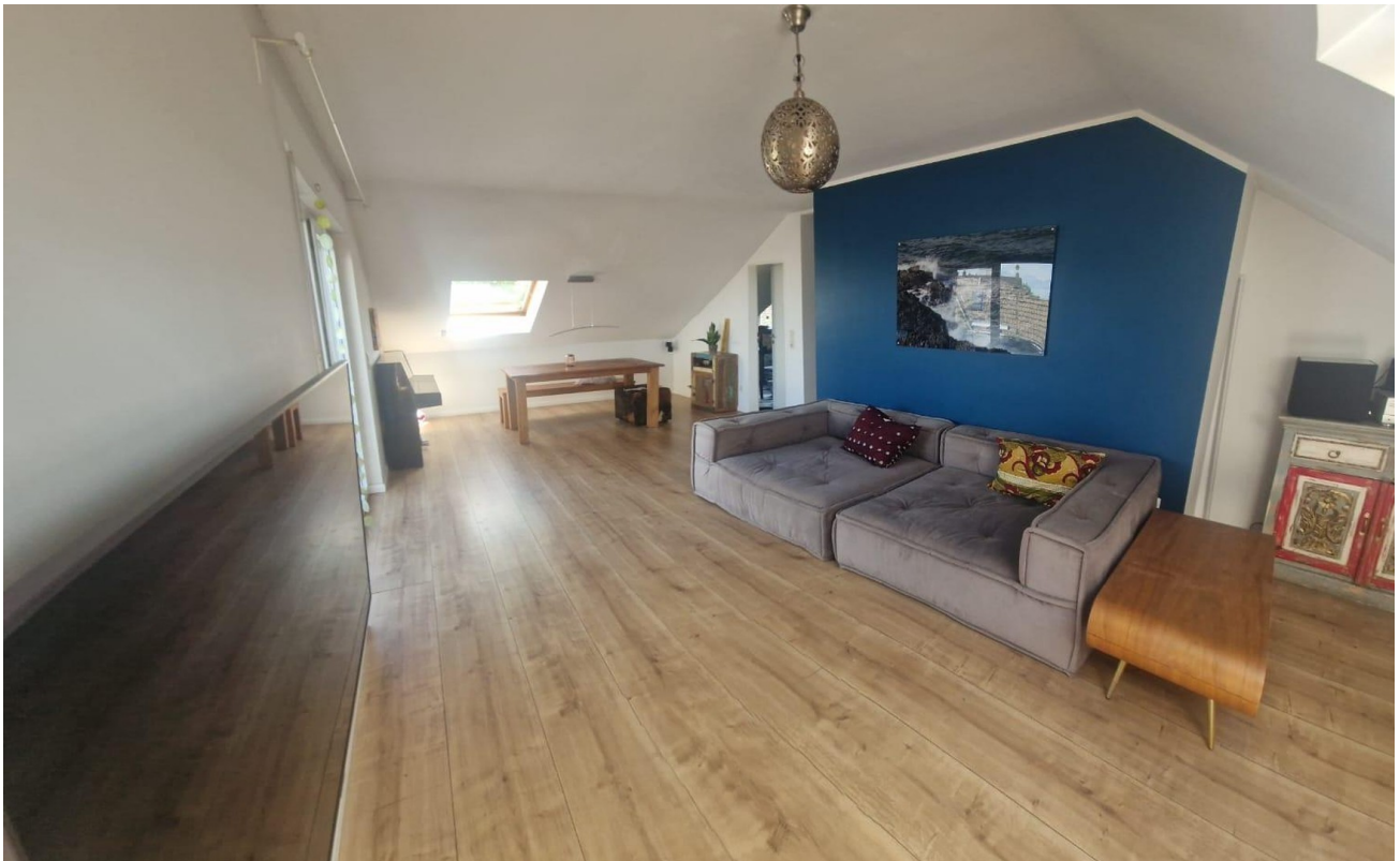
Panorama Wohnzimmer II