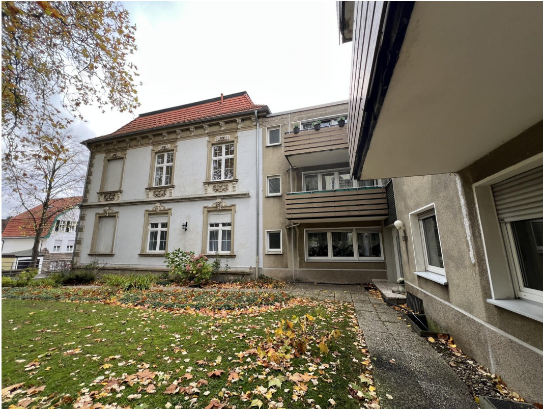
Ansicht v.d. Seite m. Balkon