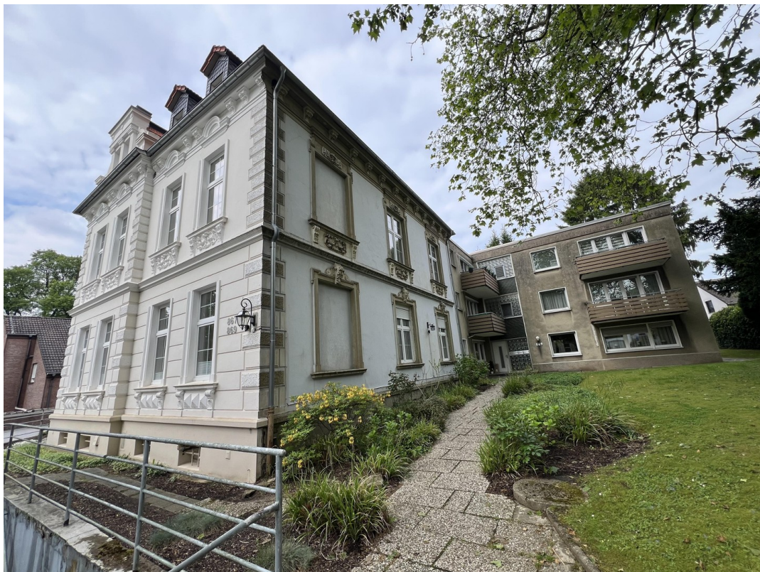
Eingangs-Ansicht v.d. Straße