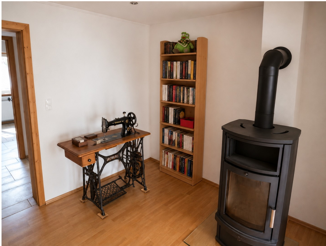
Lesezimmer mit Kaminofen