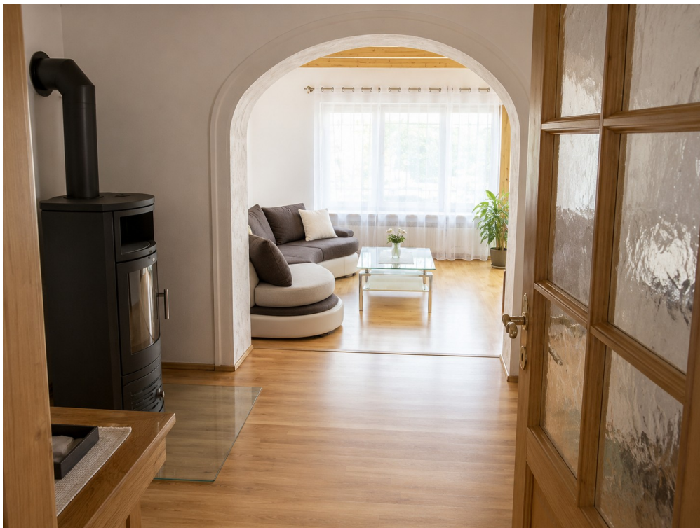
Lesezimmer mit Kaminofen