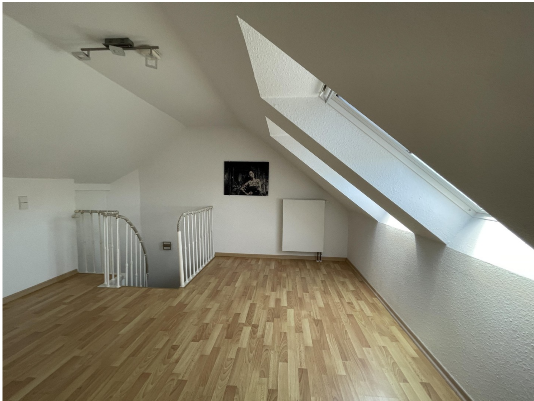
obere Ebene mit Büro / Gäste