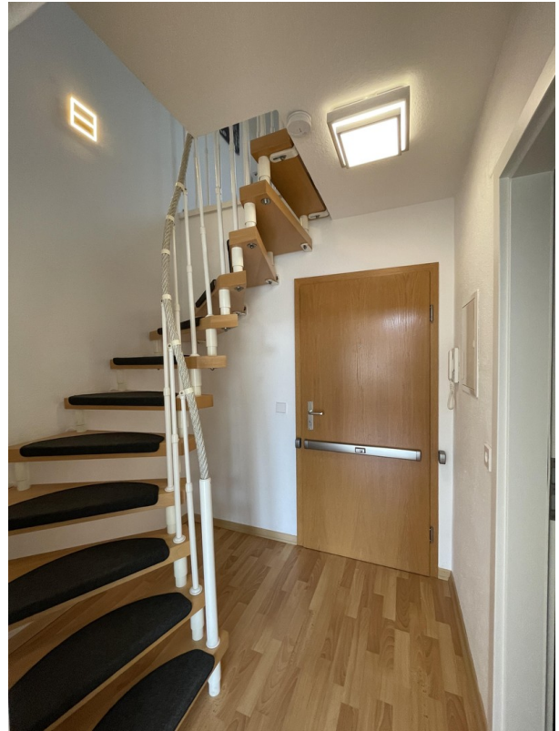
Treppe zur oberen Ebene