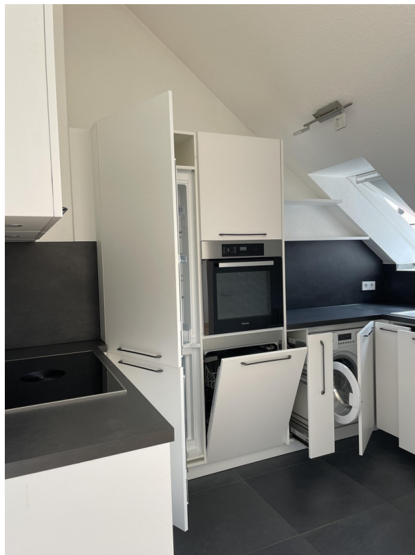
Küche mit Einbaugeräten