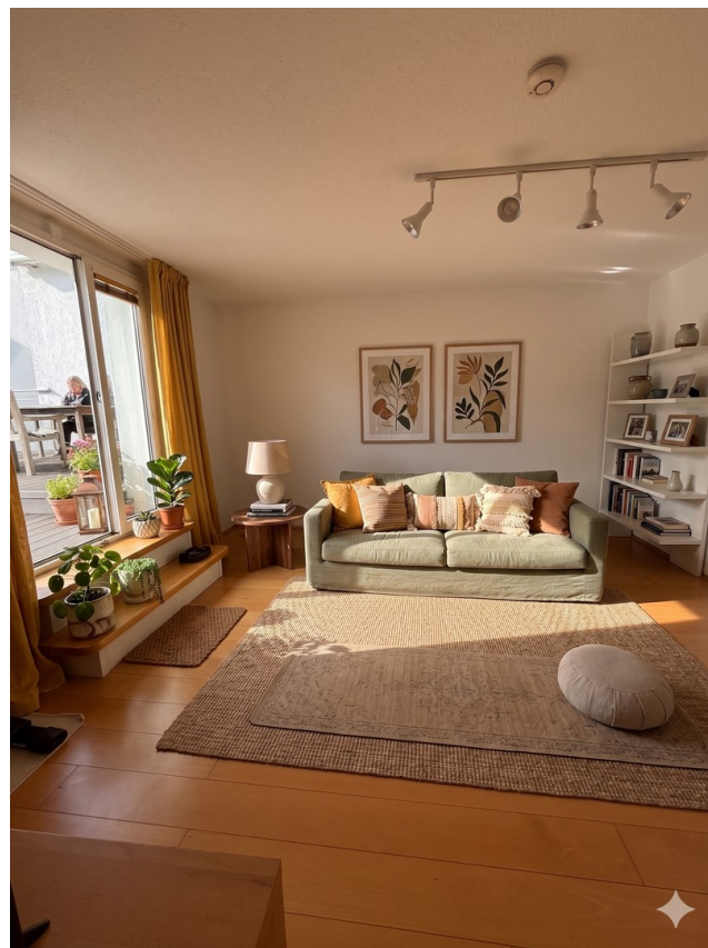
2.OG Raum vor Dachterasse