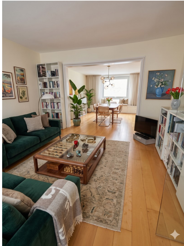
1.OG Wohn / Esszimmer