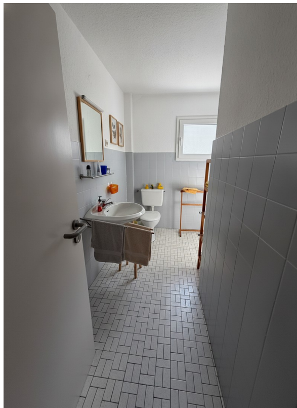
2.OG Bad Foto 2