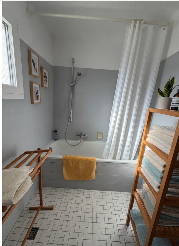
2.OG Bad Foto 1