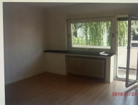
Wohnung Nr. 2 im Erdgeschoss