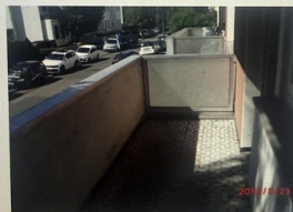
Wohnung Nr. 2 im Erdgeschoss