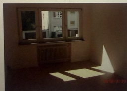
Wohnung Nr. 2 im Erdgeschoss