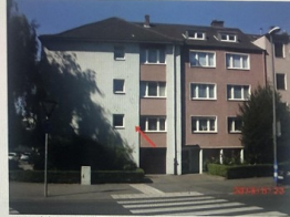
Ansicht von der Klosterstraße mit Wohnung Nr. 2 im EG