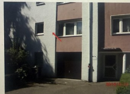
Hauseingang und Wohnung Nr. 2 im Erdgeschoss