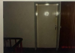
Eingang zur Wohnung Nr. 2 im Erdgeschoss

Wohnung Nr. 2 im EG Wüllerstraße 98, Köln-Lindenthal - 25 -