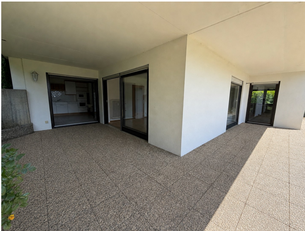
Terasse / Überdachter Freisitz