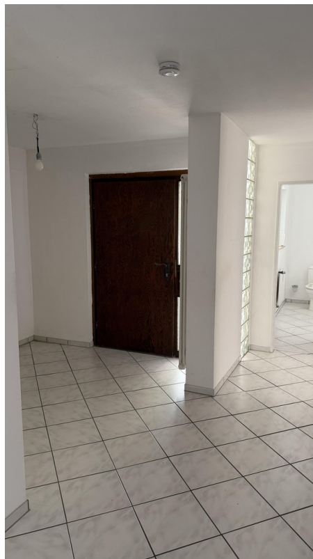
Flur / Eingang