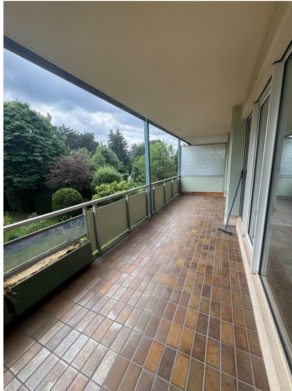
großer Balkon mit Blick Garten