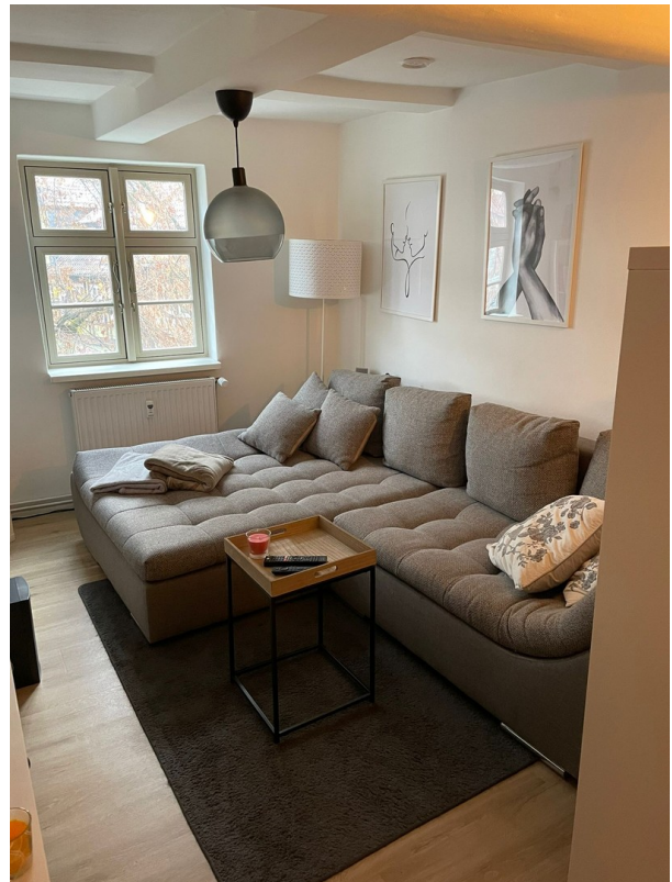
Diele / Wohnen