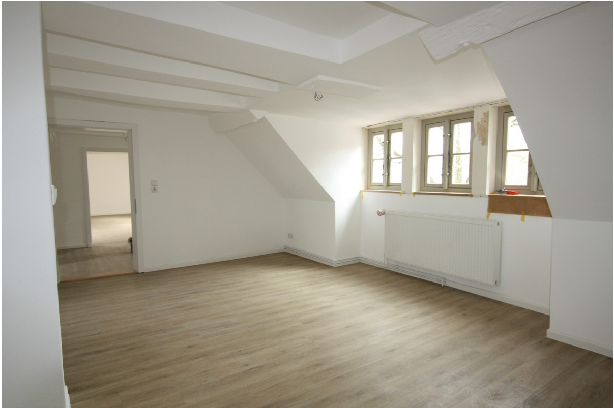
Wohnen / Essen2