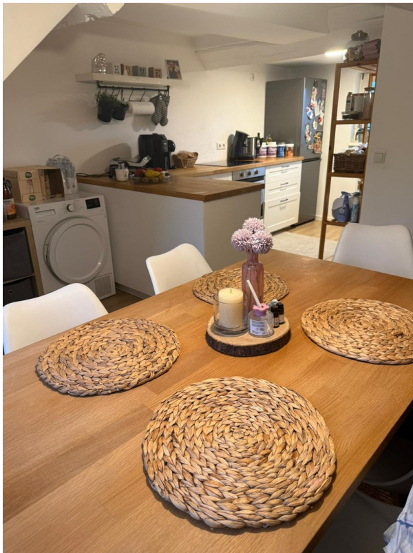
Küche u. Essbereich