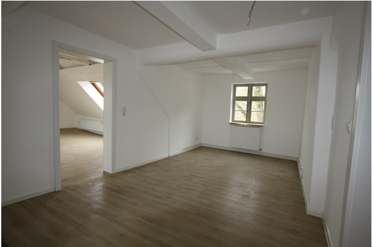
Diele unmöbliert 2